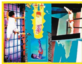
劇烈運動不是遊戲。

溫習的，知道狀元比武狀元可貴之後改變夢想，渴望男孩子是明日的潘展樂，女孩子是全紅嬋和陳芋汐；於是為有為未滿周歲的男嬰娶妻，開始接觸不同運動器材，一時興趣還好，如果出發點來自金牌的功利思維，近於虐兒轉型的虎爸虎媽就教人心寒了。 當然，全民重視運動，為了強身，也是好事，但一天到晚不斷勞動四肢的運動，可能也有一定的害處，專業運動員雖然樂在其中，但所受的艱苦亦無人不知，除非孩子天生有特別的體能應付某一運動，而他自己也確實喜歡這個運動，發揮他的長處亦未嘗不可；如果父母只是受了運動員金牌的刺激，渴望有朝一日自己的兒女也可以有這樣的本領，而天生體質未必人人一樣，一旦骨骼和身心未穩定的小兒，過早接受不適宜的訓練，便有可能發生意外了，家長怎可掉以輕心！ 讀書和運動首重健康，總要各展所長之餘，也要動靜得宜，這才符合健康之道。