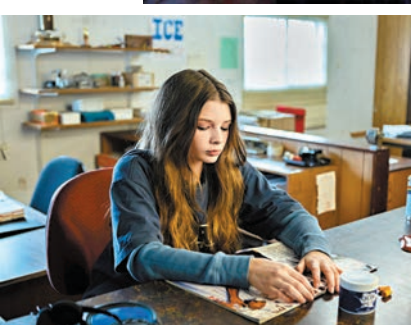
◆《長腿》今日殺到香港。