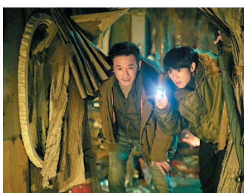
◆電影《躁底師兄2 行刑師》劇照。