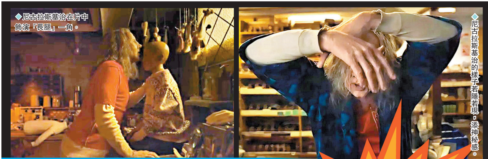
◆尼古拉斯基治在片中飾演「長腿」一角。