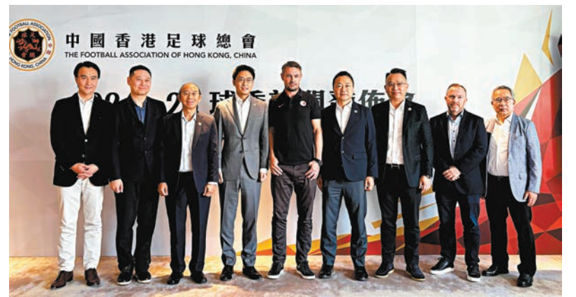
◆韋斯活(中)接掌港足兵符。

在10月和11月，港隊會有3場主場比賽及1場作客比賽，包括主場迎戰柬埔寨、菲律賓、毛里求斯，以及作客列支敦士登，而在12月亦會在港舉行東亞足球錦標賽外圍賽。