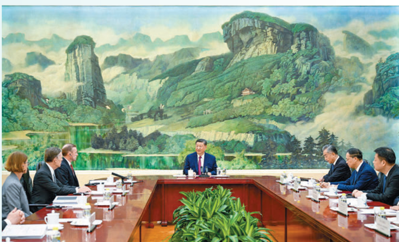
▲8月29日下午，國家主席習近平在北京人民大會堂會見美國總統國家安全事務助理沙利文。

香港文匯報訊 據新華社報道，8月29日下午，國家主席習近平在北京人民大會堂會見美國總統國家安全事務助理沙利文。