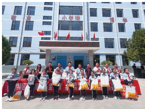
循化縣白莊鎮中心學校學生代表與一眾嘉賓大合照。

學生代表感謝香港特區政府的關愛，同時表示會努力學習，爭取成為強大動力的擔當，以報效祖國回饋社會。隨後，循化