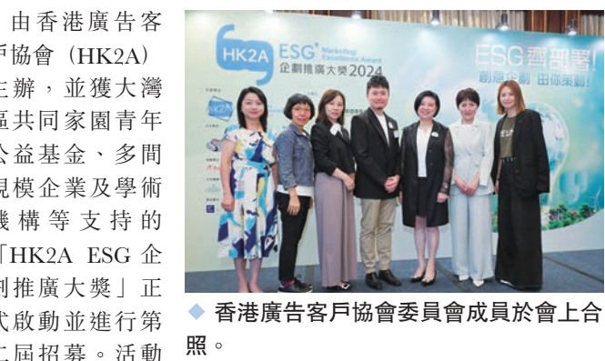
香港廣告客戶協會委員會成員於會上合照。

由香港廣告客戶協會(HK2A)主辦，並獲大灣區共同家園青年公益基金、多間規模企業及學術機構等支持的「HK2A ESG企劃推廣大獎」正式啟動並進行第二屆招募。