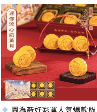
圖為新好彩運人氣爆款貓山王榴蓮冰皮月。

為滿足新老顧客不同口味的追求，今年集團攜手中央廣播電視總台「總台文創」品牌聯名上新，在去年月餅大賣的基礎上，新推六星錦月，更有往年人氣爆款貓山王榴蓮冰皮月、迷你奶黃流心月，以及福滿中秋禮