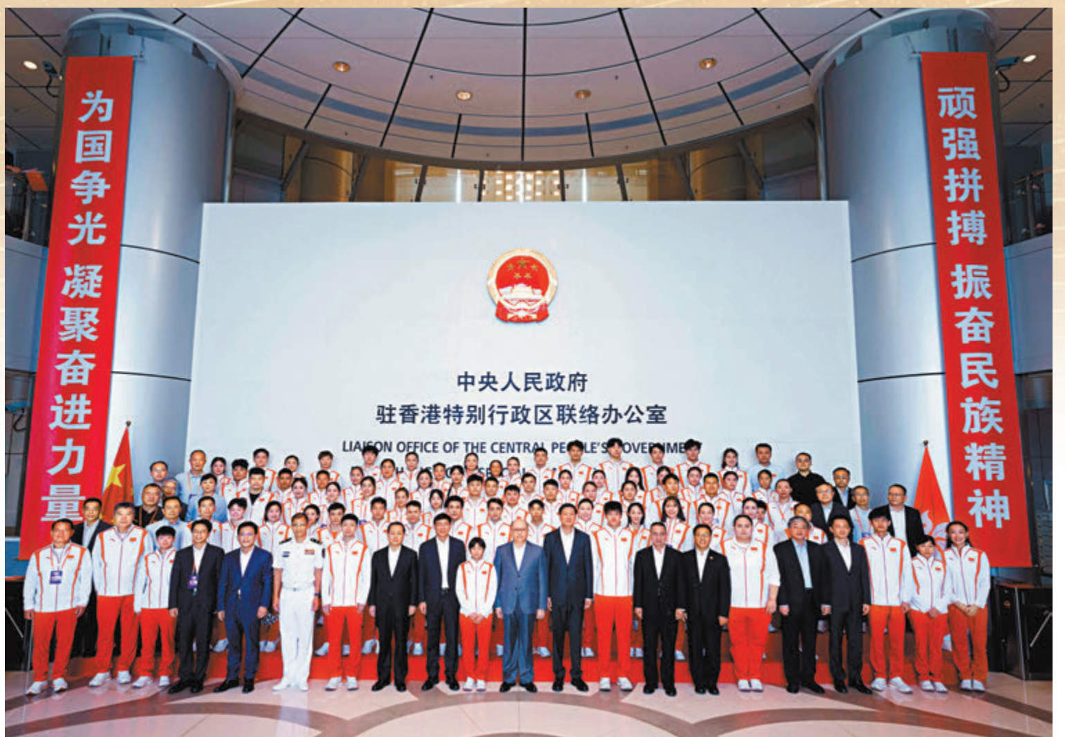
◆中央政府駐港聯絡辦歡迎內地奧運健兒代表團到訪。

代表團團長、國家體育總局局長高志丹致辭時表示，習近平總書記親切接見中國體育代表團，讚揚奧運健兒生動詮釋了新時代中國精神，充分展現了新時代中國形象。此次代表團到訪香港，就是要發揮體育獨特價值作用，與香港市民共享中華民族榮耀。駐港聯絡辦扎根