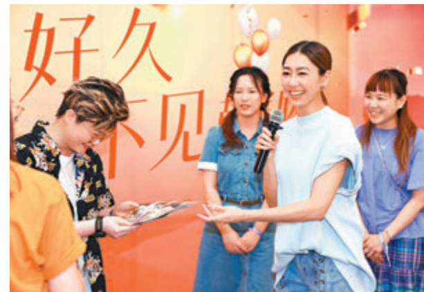
◆粉絲們為胡定欣做了很多應援小禮物。