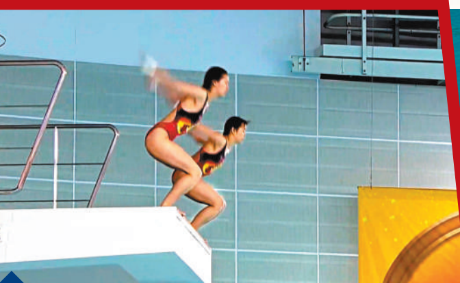
1 全紅嬋和陳芋汐示範

運動健兒們不遺餘力地向香港市民展示競技絕活，看台上觀眾們通過熱情的加油聲和運動員們互動，把香港的奧運熱情再次推向高峰。