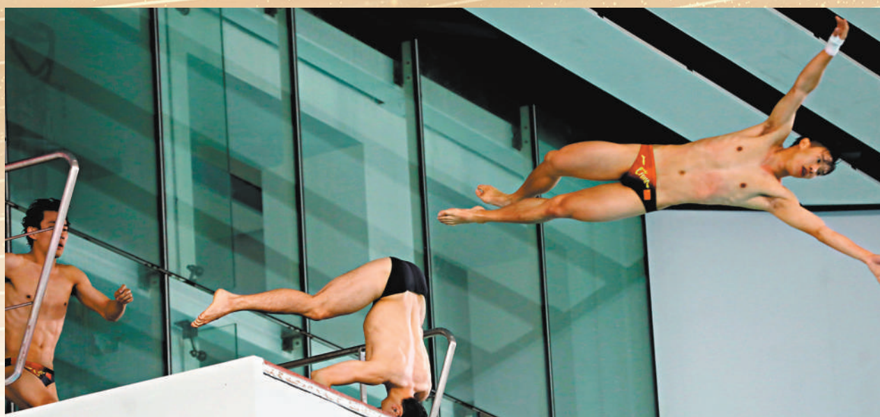
◆運動員展示平時在賽場上不會見到的創意、鬼馬跳水招式。

在訪港最後一日行程中，一眾內地奧運健兒分別出席了兩場「內地奧運健兒展風采」運動項目示範，其中跳水、游泳等共26名運動員在維多利亞公園泳館一展身手，令全場上千名觀眾大開眼界，恍如置身奧運場上一睹世界級泳術。無論是內地健兒與港隊泳手和現場觀眾以AR（擴增實境）形式進行的5×100米混合泳，「跳水天后」全紅嬋與夢幻拍檔陳芋汐重演反身跳水曲體，施展「神同步」絕技，以及一眾運動員為香港市民特別送上的「鬼馬」動作，包括示範默契度極高的「集體跳水」，均贏得全場掌聲與歡呼喝采。