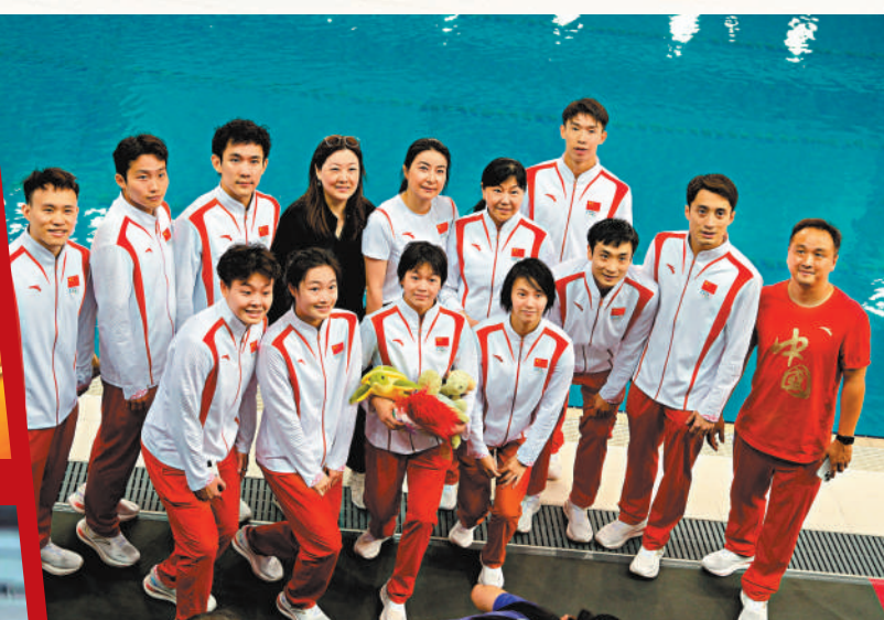
◆郭晶晶、伏明霞與中國跳水隊合影。