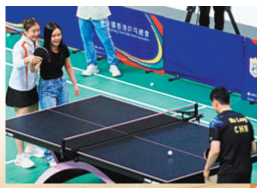
陳夢（左一）手把手教現場觀眾與馬龍（右）對戰。 香港文匯報記者北山彥 攝

昨日的壓軸環節是抽籤抽出一名從未打過乒乓球的女觀眾落場和馬龍對打，陳夢則化身教練，手把手從旁指導戰馬龍，令全場尖叫歡呼聲不斷，再度為今次活動掀起高潮，而王楚欽以廣東話向觀眾說「大家好」，並由馬龍向大家致謝。最後，內地奧運健兒離場前起立接受觀眾掌聲，為今次精彩表演畫上完美句號。賈一凡用廣東話向觀眾表示：「多謝大家支持我哋！」 ◆香港文匯報記者 張發兒、張弘