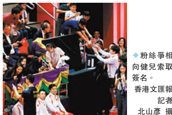
粉絲爭相向健兒索取簽名。