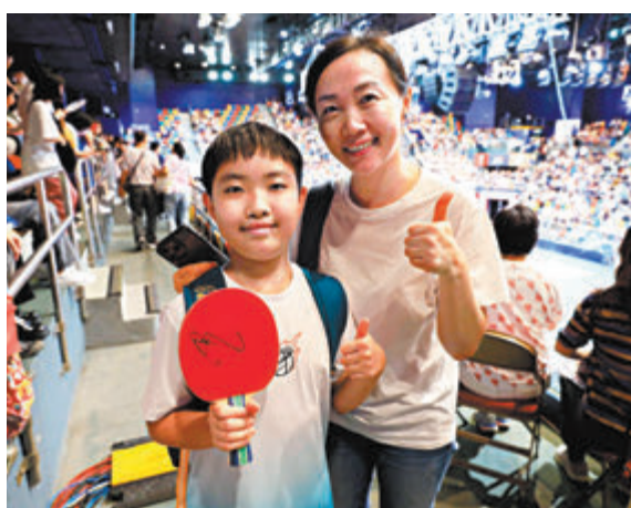
李小姐表示，兒子很幸運讓馬龍在準備好的球拍上簽名。