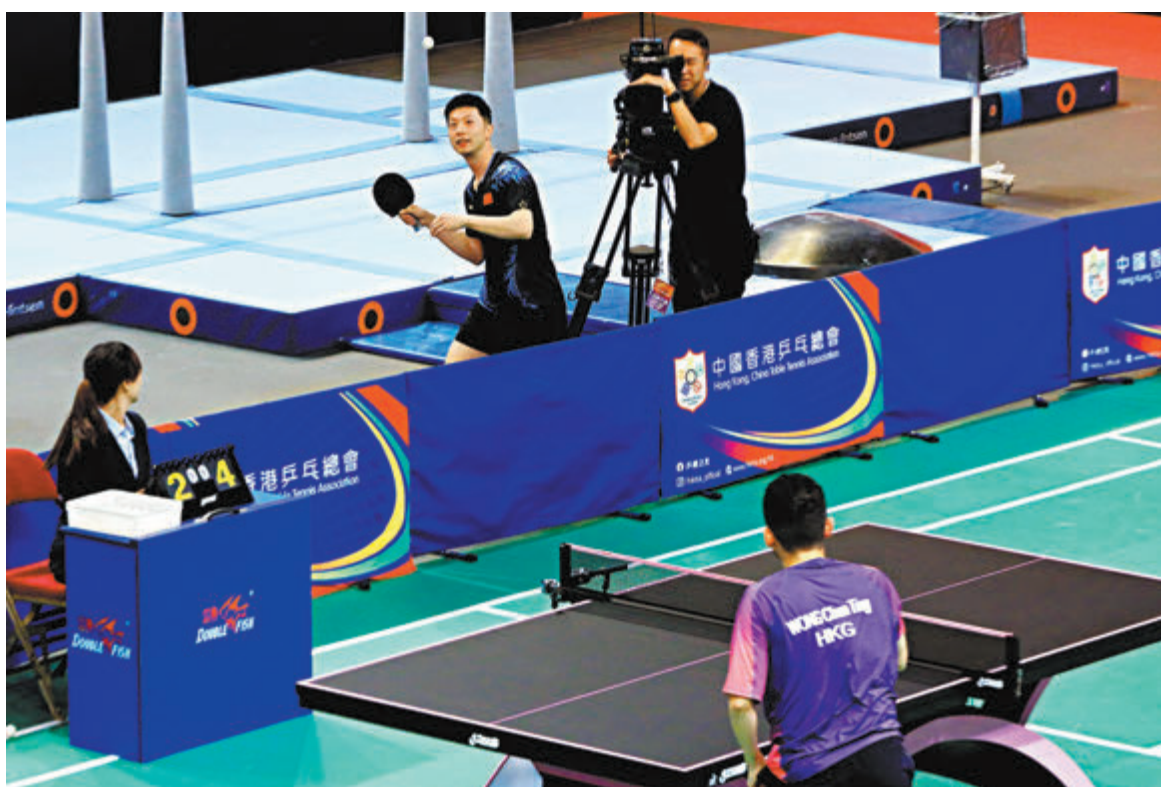
馬龍引導黃鎮廷一路圍住球拍轉圈一路對打，引來觀眾的笑聲與掌聲。

為增加難度和娛樂性，馬龍還引導黃鎮廷一路圍住球拍轉圈一路對打，引來觀眾的笑聲與掌聲。