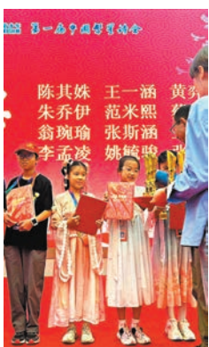
◆活動現場獲獎小朋友。作者供圖

心，一人計短，二人計長，幸福似重疊，聯袂就似生出兩個腦，神奇彩筆寫詩文，文學路上不會愁埋。 人說寫作寂寞孤單呀，我們不覺呢。有時獨處不錯，有時又能聯袂，寫作時有變化，感官特別醒神，格外令人開放又感動。 人生有幸有不幸，得與失，喜和哀，榮與辱，富共貧，似學生似的；都說人無遠慮，必有近憂，我們只要以聯袂作坐標，則相信烏雲後有銀光，雨後有彩虹，何須否定失敗或失意？ 一扇門關了，開一扇窗吧。我倆聯袂，心窗常開，精神常保正能量，即使3年疫情肆虐時，靈感未斷，借一方文字天空，慰藉你我他人，困擾現都過去，輕舟已過萬重山呀！ 失去多，人也成長得更強更有韌力，遇強愈強；聯袂即風雨同舟，情義堅如磐石。感恩生命遇上好姐妹共我手拉手，衣袖相連，聯袂走進文學花園，園中繁花佳木，姐妹愈走愈起勁，不知老之將至，愈寫愈怡悅，情誼深深路漫漫，人生豐美增質量，攜手創作添新意，快樂感恩修福緣！