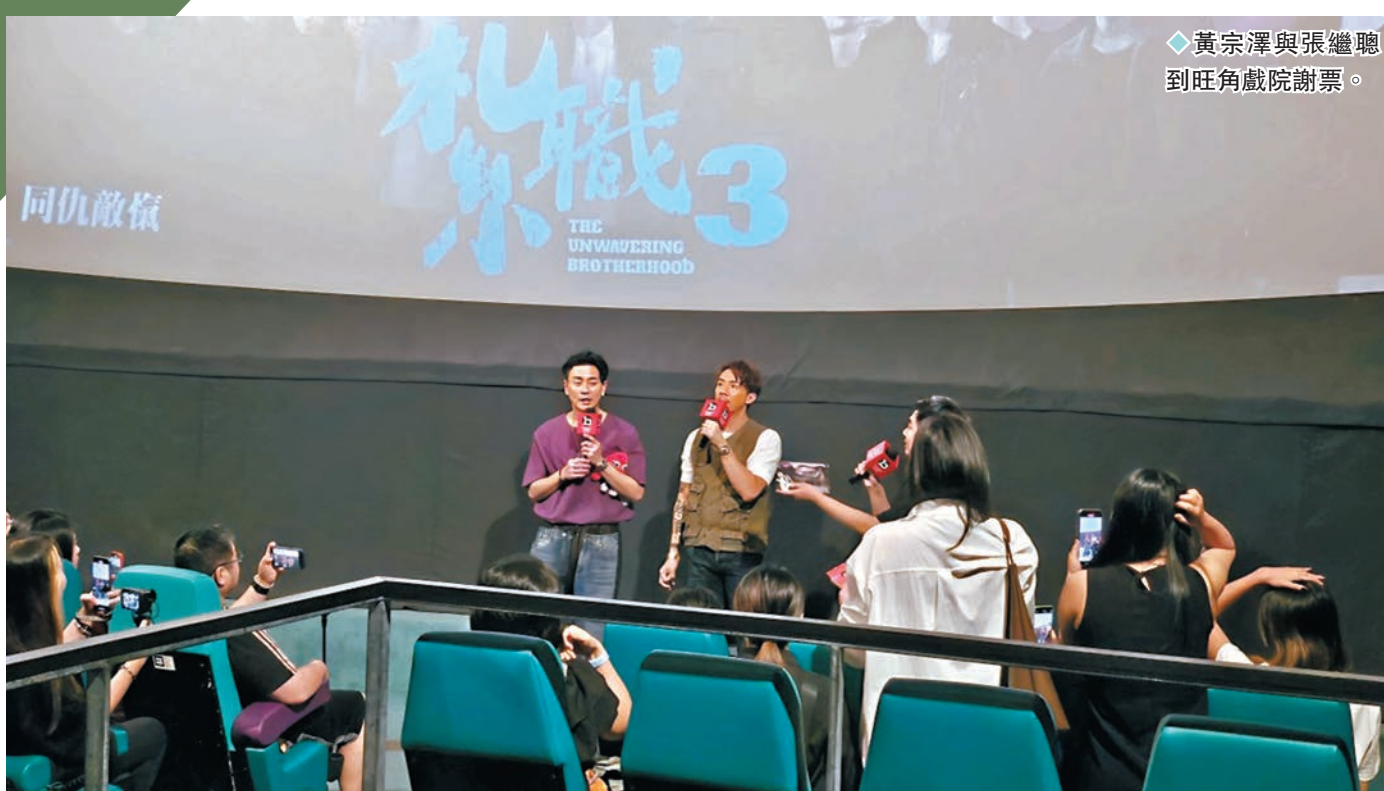
◆黃宗澤與張繼聰到旺角戲院謝票。