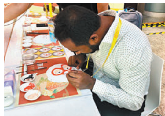
外國記者表示要將親手製作的臉譜帶回非洲，留作紀念。

此外，峰會新聞中心充分利用科技手段，為境內外媒體提供全方位優質服務。8K沉浸式大屏穿越中軸線直抵非洲草原、精通多國語言的人形機器人與非洲記者對答如流、30秒播報即