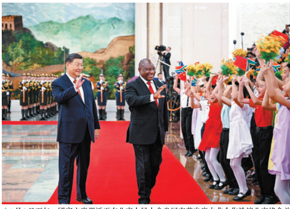
9月2日下午，國家主席習近平在北京人民大會堂同來華出席中非合作論壇北京峰會並進行國事訪問的南非總統拉馬福薩舉行會談。這是會談前，習近平在人民大會堂北大廳為拉馬福薩舉行歡迎儀式。