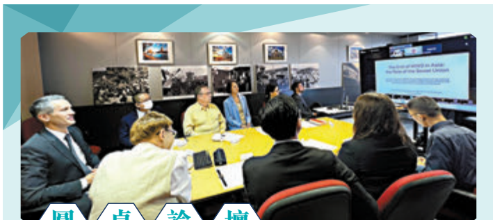
◆今天（3日）是中國人民抗日戰爭勝利紀念日。俄羅斯聯邦駐港總領事館昨日舉辦圓桌論壇，邀請來自內地、香港、俄羅斯的學者透過網上網下方式，共同討論第二次世界大戰亞洲和太平洋戰場的歷史情況以及對後世的影響。俄羅斯駐港總領事阿納托利·卡爾加波洛夫（圖中左一）出席了論壇。◆香港文匯報記者 康敬