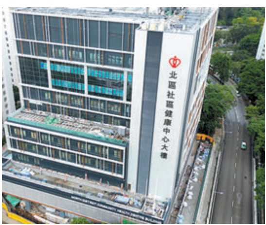
◆石湖墟學生健康服務中心，即日起於北區社區健康中心大樓九樓提供服務。

有設施，包括學童醫療紀錄儲存室、量度室、健康教育室、視力及聽力檢查室、接見室、診症室、莫爾照相室外，亦會於部分時間增設健康評估中心服務（即由視光師、聽力學家、營養師及臨床心理學家所提供的服務），與學生健康檢查服務位處同一樓層，為學生提供一站式服務，免卻他們跨區長途跋涉前往其他的健康評估中心接受服務。