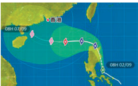
◆天文台考慮在今日發出一號戒備信號。

香港文匯報訊（記者 蕭景源）熱帶風暴「摩羯」昨日移向呂宋北部及有所增強，預計今日進入本港800公里範圍內，隨後靠近華南沿岸再進一步增強，較大會移向廣東西部至海南島一帶。天文台考慮在今日下午至晚上發出一號戒備信號，並視乎「摩羯」的強度、環流大小及與香港的距離，考慮會否發出更高的熱帶氣旋警告信號。受其影響，預計廣東沿岸本週後期天氣會轉壞，風勢會增強，有狂風大驟雨，海有大浪及湧浪。