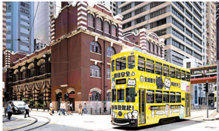
◆三部車身印上「全城攜手 網安在手」電車車身設計比賽得獎作品的電車，即日起將於港島穿梭電車沿線至本月29日。

隨着人工智能（AI）技術普及，相關網絡安全隱患亦層出不窮。今年第二季香港錄得3,058宗單一網絡安全事件，按季上升27%，當中約六成涉及網絡釣魚個案，亦有殭屍網絡（佔23%）及惡意軟件（佔7%）等其他威脅。香港網絡安全事故協調中心（HKCERT）指出，AI「武器化」是今年五大資訊安全風險之一，尤其是AI可用於編寫程式，降低成為黑客的技術門檻。為提高香港市民的網絡安全意識，響應國家網絡安全宣傳周，HKCERT連同特區政府數字政策辦公室及香港警務處舉辦電車宣傳活動，三部車身印上「全城攜手 網安在手」電車車身設計比賽得獎作品的電車，即日起將於港島穿梭電車沿線至本月29日。 ◆香港文匯報記者 唐文、蕭景源