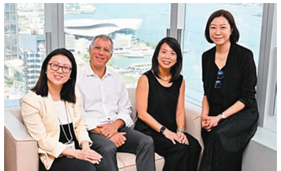
◆ 滙控行政總裁艾橋智 (左二)、滙豐香港區行政總裁林慧虹 (左三)。

香港文匯報訊 (記者 馬翠媚) 滙控 (0005) 新任行政總裁艾橋智昨日正式接棒，在履新後他連同滙豐多名亞太區、香港高層走訪不同辦公室和