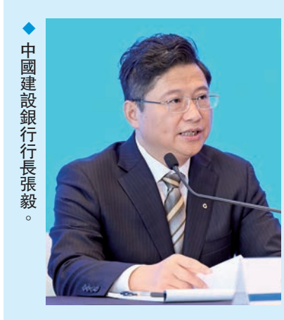
中國建設銀行行長張毅。

中國建設銀行(0939)(以下簡稱「建行»)日前曬出今年上半年「成績單」,並於9月2日香港和北京同步舉行2024年中期業績發布會。建行新任行長張毅用「業務發展均衡協調,資產質量保持平穩。」來評價上半年的成績。展望未來,他提到,下半年建行將繼續以高質量發展為主題,持續增強風險思維、全局思維、發展思維、客戶思維、協同思維、競爭思維「六種思維」,專注主責主業,開展零售信貸、資金穩固、中間業務提質、降本增效、客戶深耕「五大行動」,把建行各項工作融入到進一步全面深化改革大局中去謀劃推動。