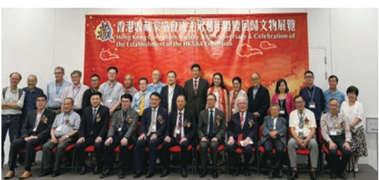
◆一眾主禮嘉賓與協會成員在開幕式上合照。

香港收藏家協會成立30周年暨慶回歸文物展覽早前（27日）假香港中央圖書館開幕，香港特區政府律政司司長林定國應邀出席，在協會會長唐卓敏、副會長江樂士及任正全陪同下，與一眾嘉賓共同主持了開幕儀式。