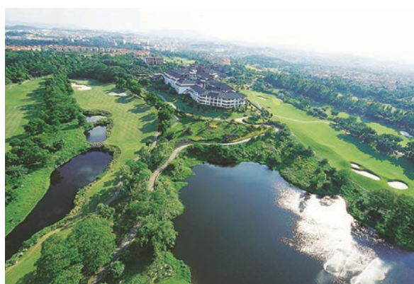
◆賽事將於蜚聲世界的深圳觀瀾湖高爾夫球場舉行。

「PIF呈獻：沙特阿美石油團體系列賽」本賽季第四站比賽將於10月4日至6日在深圳舉行。這是女子歐洲巡迴賽（LET）時隔七年之後，首次重返中國內地。本站賽事總獎金100萬美金，將在深圳觀瀾湖的世界杯球場舉行，這座由傑克·尼克勞斯設計的球場，屆時將迎來眾多世界頂級高爾夫球手，競爭個人和團體獎杯。