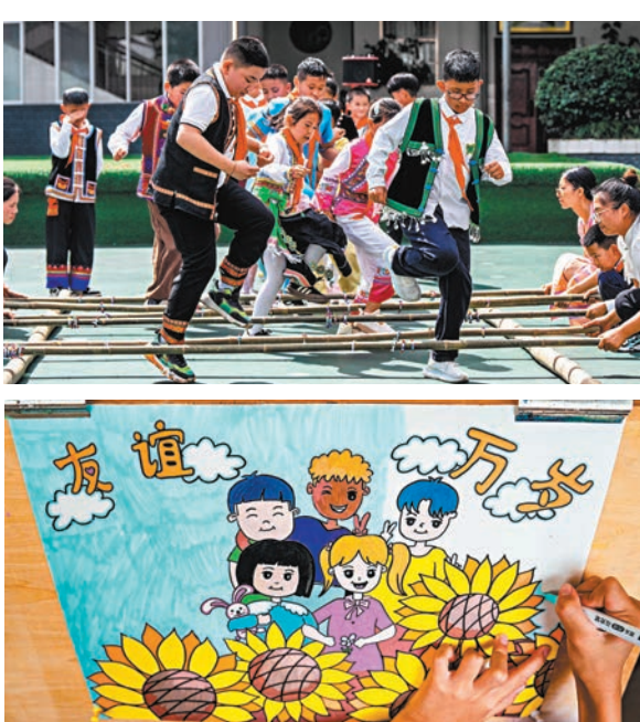
◆一名學生在創作以中赤幾友誼長青為主題的繪畫作品。