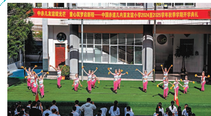
▲9月2日，在中國-赤道幾內亞友誼小學，學生在表演特色舞蹈。

就如峰會舉辦前夕，中國外交部發言人重申，一個中國原則是國際社會的普遍共識，183個國家已經在一個中國原則的基礎上同中國建立了外交關係，我們希望少數數還同台灣地區保持所謂「外交關係」的國家能夠認清歷史大勢，盡快作出符合自身利益的決斷。