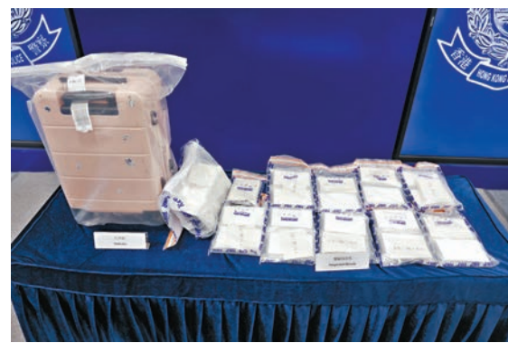
◆「飛機豬」將毒品藏於行李運港。