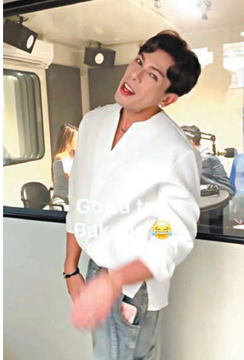
古淖文搞怪模仿支譽儀說話神情。

當4人唱罷《不再猶豫》返回後台,現場觀眾安歌之聲不絕於耳。最終,4人穿著《中年好声音 Power Of Live》製作團隊T恤,再踏上舞台,為大家獻上當晚最後一曲《祝福》。演出結束後,心思細密的北美粉絲為German提早慶祝生日,送上生日祝福。