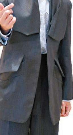
馮允謙眉眼彎彎比心靚粉。