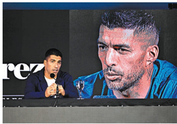
◆蘇亞雷斯宣布退隊的消息。

場國際賽的第69個國家隊入球。蘇亞雷斯曾是利物浦及巴塞隆拿的主力前鋒，隨巴塞贏得15個錦標。