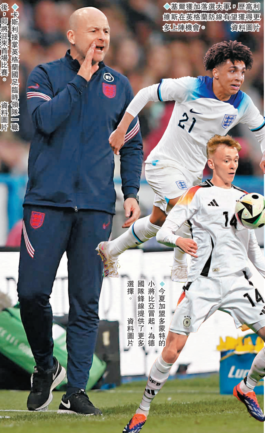
◆卡斯利接掌英格蘭國足臨時領隊一職，即將迎來首場比賽。