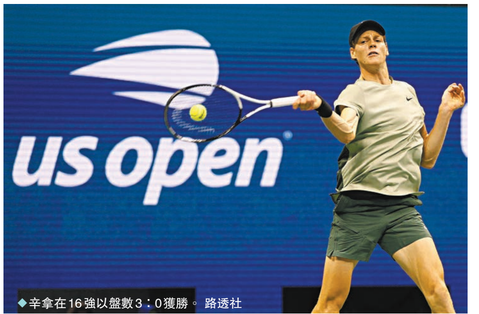
◆辛拿在16強以盤數3：0獲勝。