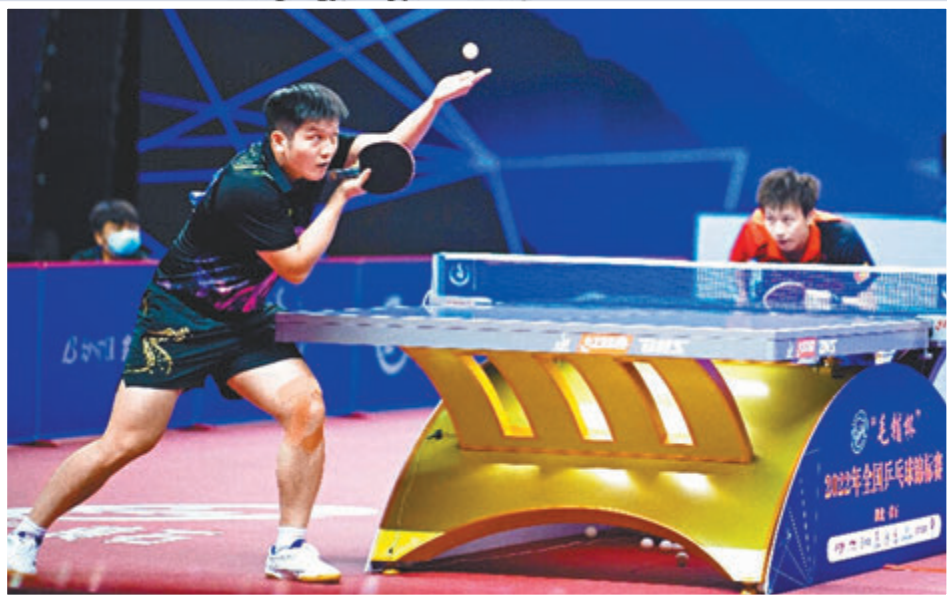
◆2022年全錦賽決賽階段，林高遠主教練張超曾因指出樊振東的不足，被樊振東的粉絲網暴。圖為樊振東與林高遠對決現場。

8月3日的巴黎奧運會乒乓球女單決賽，同來自國乒的陳夢與孫穎莎為全世界帶來一場精彩絕倫的巔峰對決。然而令人意想不到的，面對贏得比賽的陳夢，直播鏡頭中看台上一位女粉絲居然對其豎起中指。事件引起坊間一片嘩然。