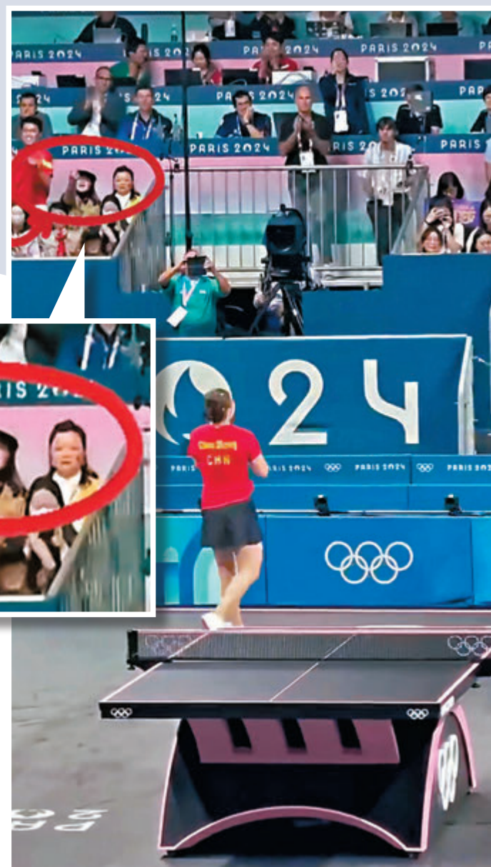
▲8月3日，奧運會乒乓球女單決賽，國乒陳夢戰勝孫穎莎奪冠。然而卻遭看台上一名女子豎中指侮辱。網絡視頻截圖