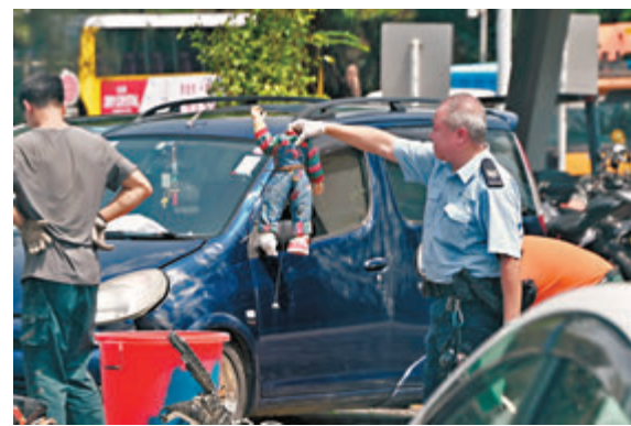
◆警方在私家車內尋獲《娃鬼回魂》公仔身軀。

事發於2日晚約9時18分，姓黃高級關員(46歲)駕私家車上班途中，在橋面失控凌空翻滾，兩