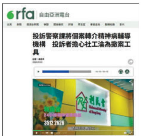
◆警方批評自由亞洲電台一則報道內容損害警民關係及警隊形象。網站截圖

法官所作出的事實裁斷的「疊加效應」是壓倒性的。同時，原審法官指答辯人可能從其他道路進入暴動核心範圍，或可能不知道當時有暴動發生，是純屬臆測，因此無罪判決有悖常理，裁定律政司上訴得直，下令撤銷原審的無罪判決。