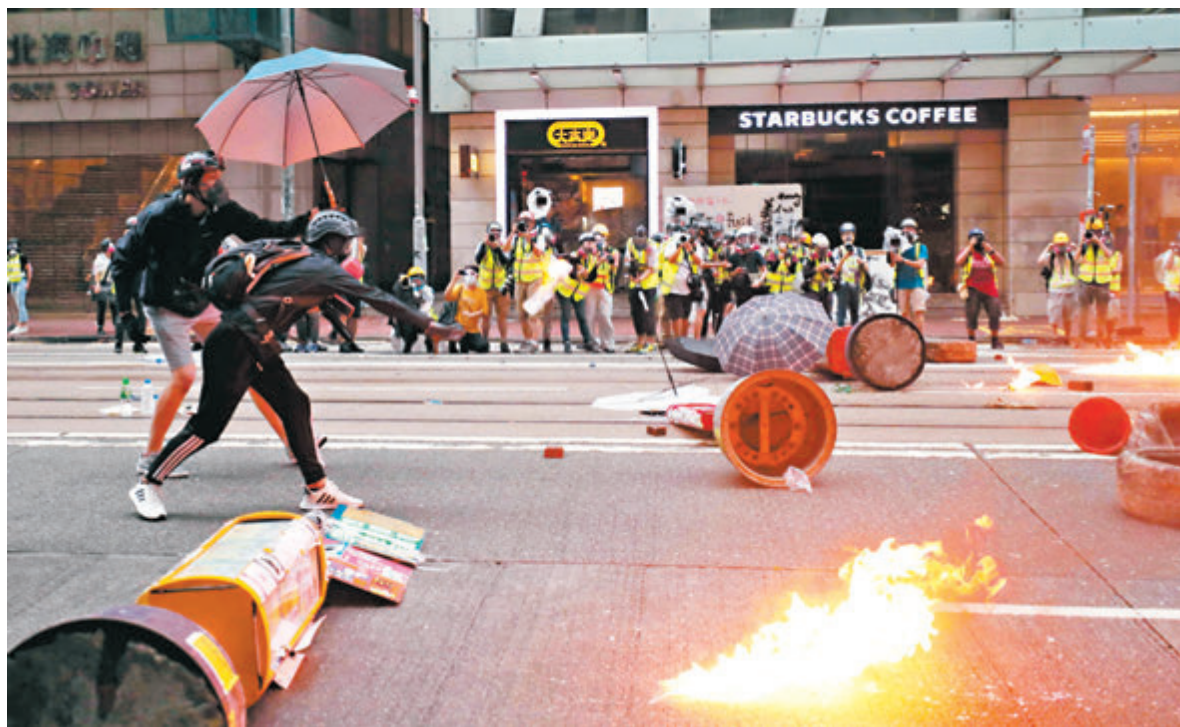
◆圖為2019年10月6日大批暴徒在灣仔一帶暴動搞破壞。

上訴庭在今年6月就是案頒下書面判決理由指，既然原審法官已裁定了答辯人的裝備是「有備而來」，並非無辜途人，且全數人都是在暴動完結前、在暴動範圍內被捕，加上是次暴動歷時超過30分鐘，現場有人縱火、多次向警員投擲汽油彈，