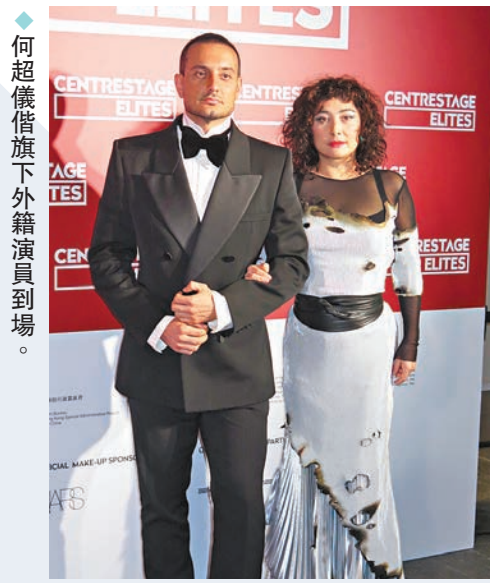
何超儀借旗下外籍演員到場。