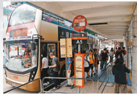
◆市民在八號風球前趕回家，交通暢順。

康文署回覆香港文匯報表示，已於包括社交媒體、電視台及電台等多個渠道加強宣傳，呼籲市民在惡劣天氣下遠離岸邊，勿往泳灘進行水上活動，以免危及個人及救援人員安全。漁護署表示，昨晚未有關閉任何郊野公園及海岸公園，但由於颱風迫近本港，為安全着想，呼籲市民避免前往郊野公園及海岸公園。