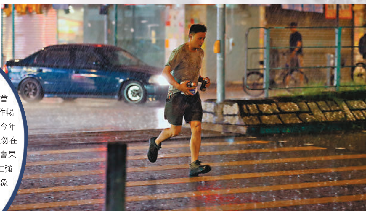
▲超強颱風「摩羯」昨日迫近香港，天文台傍晚改掛八號風球。圖為市民奔跑躲避風雨。