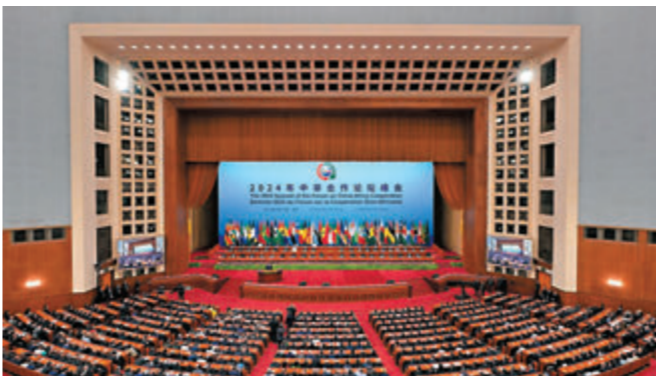
9月5日上午，中非合作論壇北京峰會在北京人民大會堂開幕。