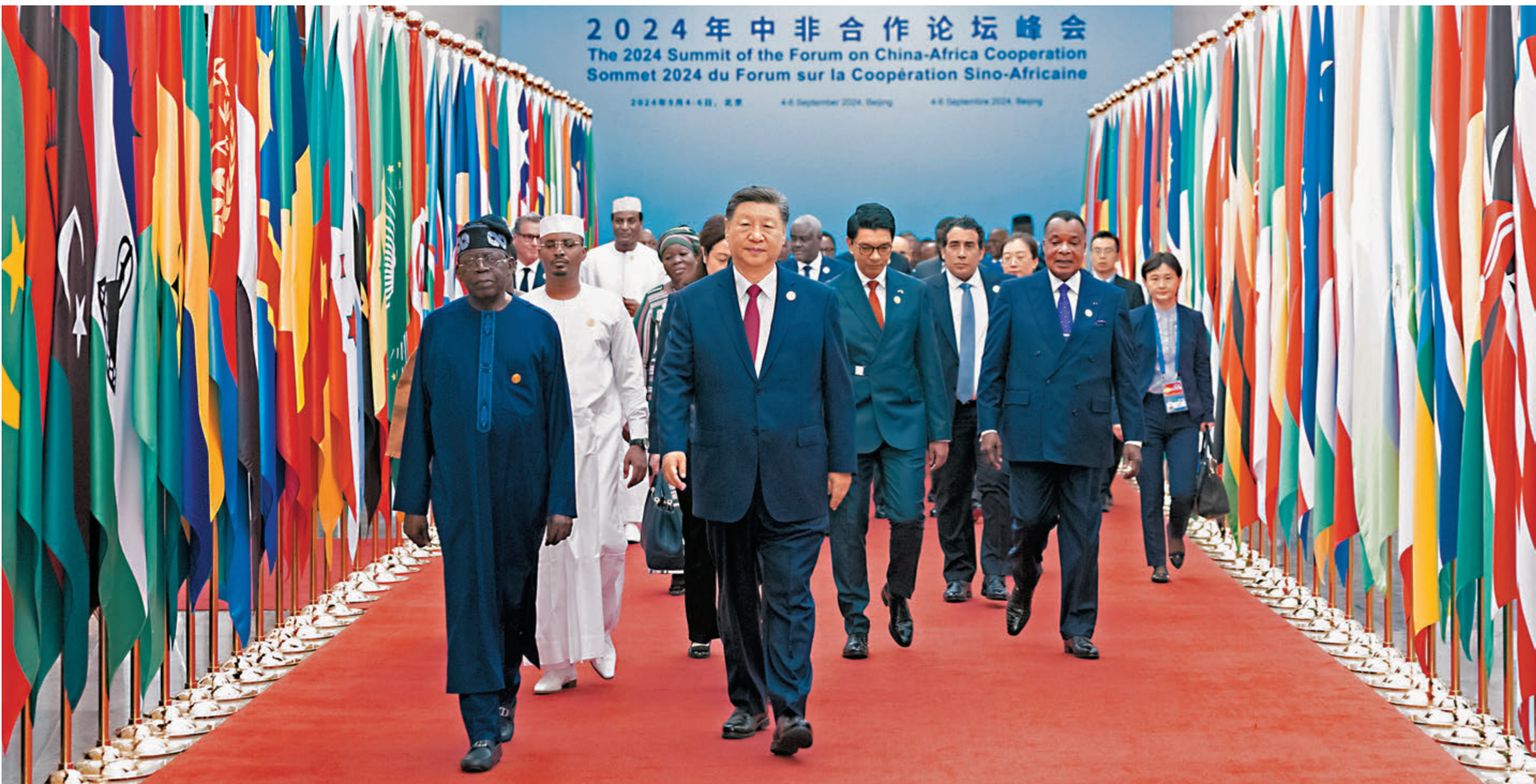
9月5日上午，國家主席習近平在北京人民大會堂出席中非合作論壇北京峰會開幕式並發表主旨講話。圖為習近平同外方領導人共同步入會場。