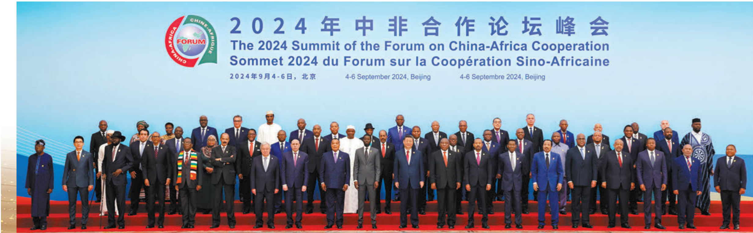
開幕式前，習近平同出席峰會的外方領導人集體合影。

中非合作論壇成立於2000年，目前有中國、53個與中國建交的非洲國家和非盟委員會共55個成員。本次峰會主題為《攜手推進現代化，共築高水平中非命運共同體》。開幕式後還將舉行主題分別為治國理政、工業化和農業現代化、和平安全和高質量共建「一帶一路」4場高規格會議。