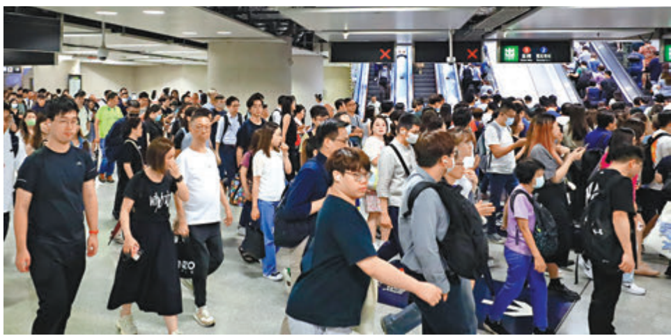
▲金鐘地鐵站颶風過後出現「返工潮」。

香港文匯報訊(記者 吳健怡)隨著超強颱風「摩羯」昨午在海南省文昌登陸，香港天文台昨日中午12時40分改發三號強風信號，取代八號東北烈風或暴風信號，打工仔在放了半日「風假」後趕出門上班，多區出現上班人潮。其中，港鐵金鐘站作為主要轉線車站，月台一度聚集不少市民候車，部分車廂逼滿人。有市民在天文台改發信號前已出門上班，避開人潮最高峰。