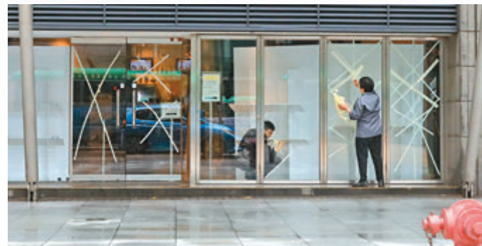
◆天文台改發三號強風信號後，有店舖職員忙於清理貼在玻璃上的防風膠紙。