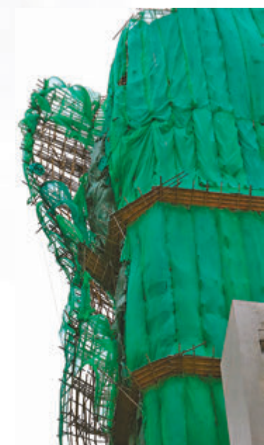
◆尖沙咀有外牆棚架被強風吹至搖搖欲墜。