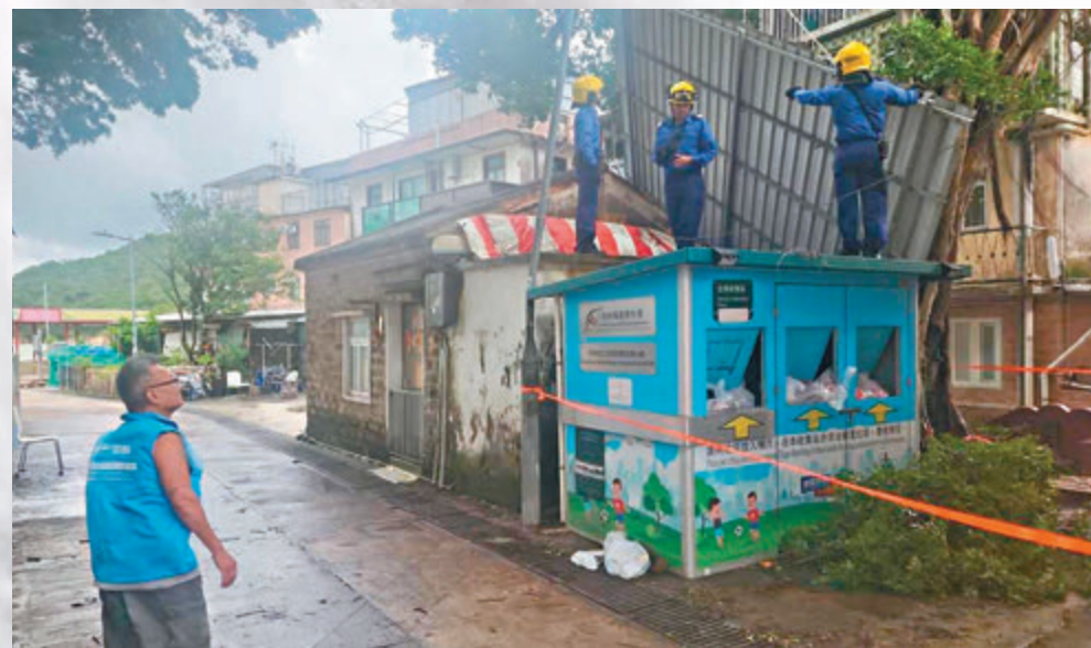
◆八號風球期間，坪洲疑有鐵皮屋的頂部被吹至飛脫「飄到」另一間平房屋頂上。