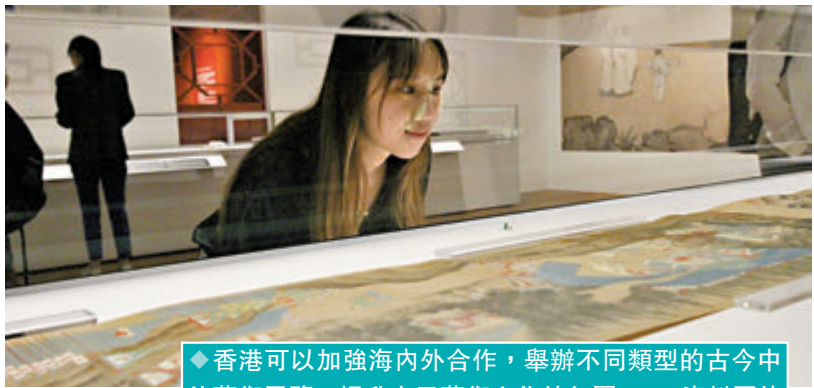
◆香港可以加強海內外合作，舉辦不同類型的古今中外藝術展覽，提升市民藝術文化的氛圍。