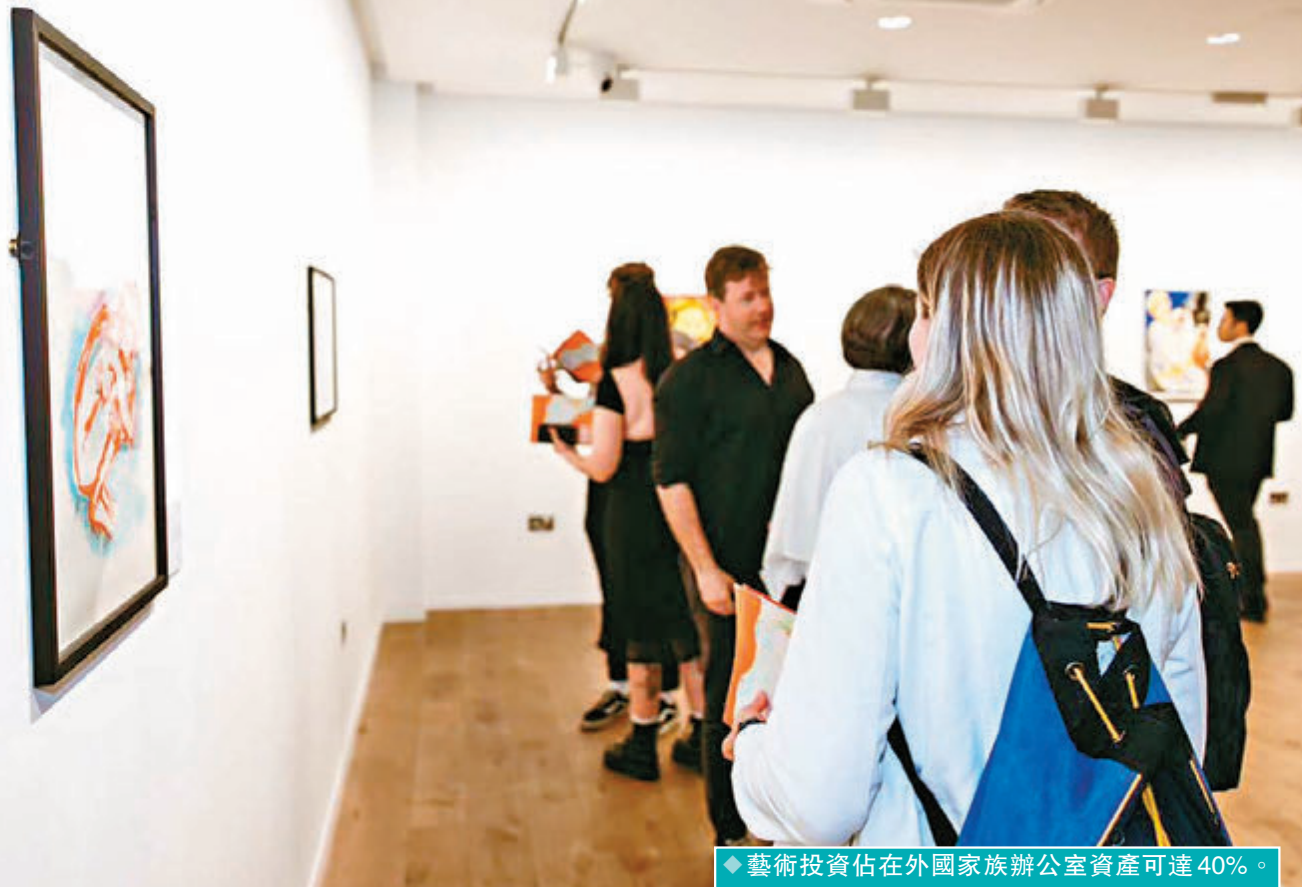
◆藝術投資佔在外國家族辦公室資產可達40%。圖為早前於倫敦舉行的畫家 Avidyā 之畫展。