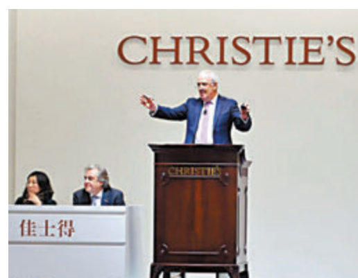
◆在港發展多年的佳士得9月遷往中環The Henderson共5萬方呎樓面。資料圖片

香港在全球藝術品拍賣市場份額亦從2019年的17.5%增至2020年的23.2%，首次超越倫敦，僅次紐約，成為世界三大藝術品拍賣市場之一。根據特區政府統計處數據顯示，在2022年，香港文化及創意產業的藝術品、古董及工藝品界別的機構單位數目約為6,870間。