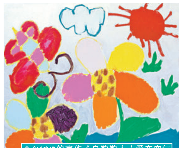
◆Avidyā 的畫作《自欺欺人（愛在空氣中）》（左）及《夏天》（右）將於10月在香港視覺藝術中心展出。