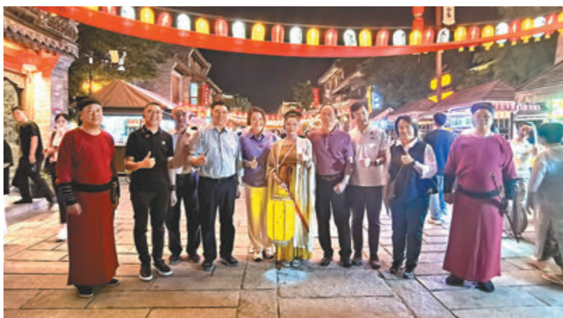
▲視察組一行於6日晚間前往洛邑古城，視察洛陽的夜經濟和文旅商業綜合體的運營情況。