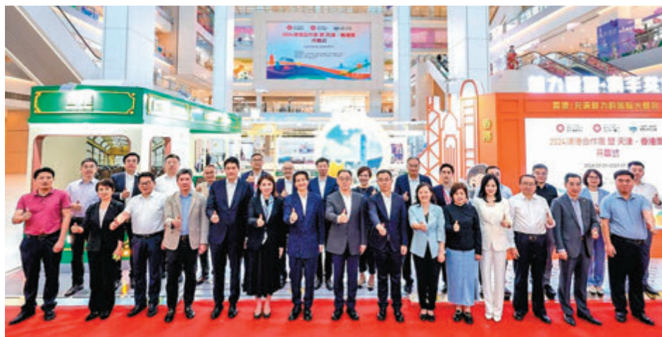
◆2024津港合作周暨天津·香港周拉開帷幕。