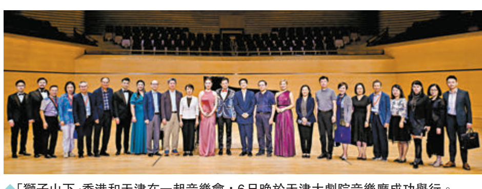
◆「獅子山下」香港和天津在一起音樂會，6日晚於天津大劇院音樂廳成功舉行。

鄭偉源出席音樂會時表示，國家「十四五」規劃綱要明確支持香港發展成為中外文化藝術交流中心，特區政府銳意推動文化發展，豐富文藝創意內容，提升文化基建，以進一步完善產業生態圈建設。同時，特區政府致力向世界各地展示香港的文化藝術氣息和活力，打造獨特的文化項目和全方位推動文化盛事，進一步推廣香港中西文化薈萃和多元面貌。