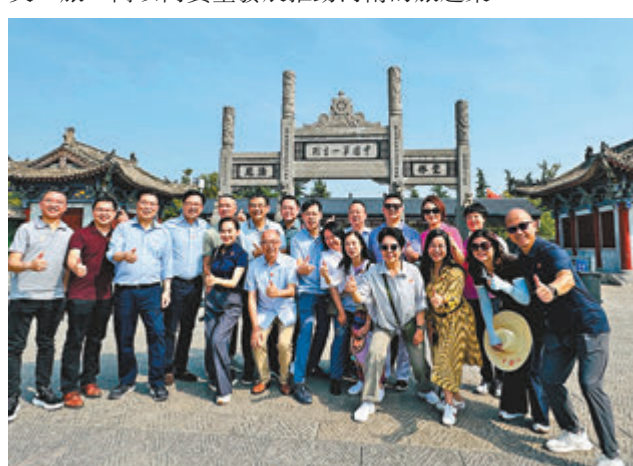
◆視察組一行探訪了白馬寺。

他建議河南省旅遊局在香港、澳門多作重點推介，吸引更多的港澳朋友到河南各地欣賞它的旅遊資源，結合文、旅、商以高質量發展推動河南的旅遊業。