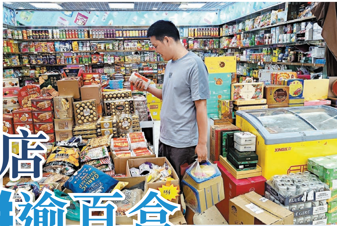
▲不少內地市民購買多盒港式月餅準備送禮和與家人品嚐。