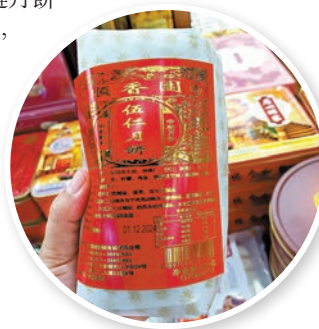
▲有商家指，最近每天最多可賣數百盒月餅。