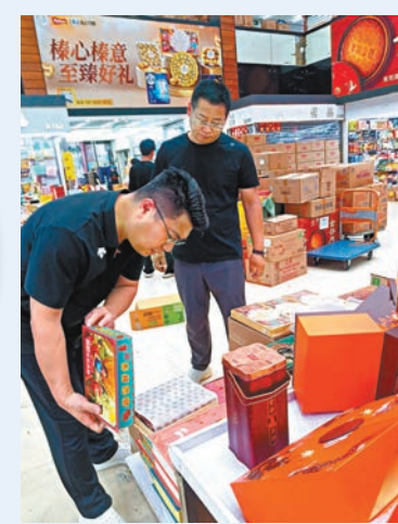
▲港式月餅受到深圳市民青睞。