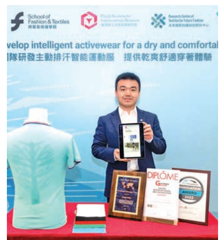
◆ 理工大研發的「iActive」智能運動服。