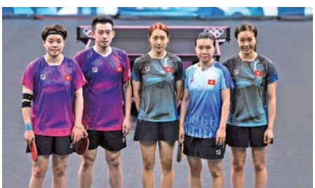
◆ 中國香港乒乓球代表團在2024年巴黎奧運會上的賽事服裝。