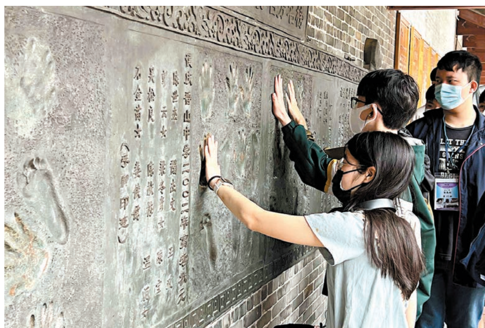
● 公民科學生內地考察團赴粵開展參訪活動。資料圖片

由於應考公民科的考生絕大部分都參加過前赴內地交流的遊學團，因此他們以親身感受和遊學期間學到的國情知識融入考試當中，這種沉浸式學習是以往集中學習書本上的知識所不能做到的效果，也體現了國情教育邁向多元實踐。