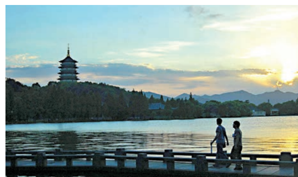
● 圖為西湖日落。

《人民的西湖》中文版加入了由香港中文大學、城市大學和香港大學聯合發起的「閱讀」（Open Books Hong Kong）計劃。這是香港首個開放取用圖書計劃，讓讀者免費閱讀、下載、取用和傳播計劃包含的所有圖書。開放取用