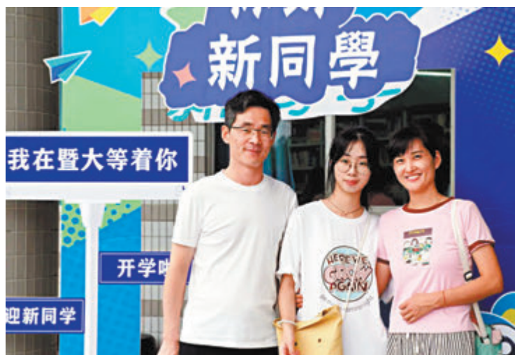
●暨南大學新生和父母打卡留念。