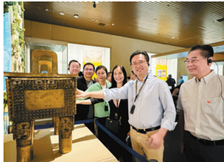
●視察組一行9日早上視察殷墟博物館。

視察組一行首先前往殷墟博物館。該館位於洹水河畔，與殷墟宗廟宮殿區隔河相望，是全國首個全面展示殷商文明的國家重大考古專題博物館。在過程中，代表們對館內的鎮館之寶——商代的「亞長」牛犧尊（一件祭禮的酒器）震撼不已，對古人在青銅器製作上的匠心獨運表示敬佩。還看到了商代人使用的陶器「搓澡巾」，了解了商朝的社會生活情況，而一片片甲骨文更是向世人訴說着千年前的殷商故事。