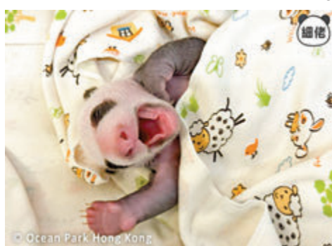
●細佬睡覺都舉手。大熊貓官方Ig

香港文匯報訊 夜深了，大熊貓BB會唔會發夢呢？大熊貓盈盈一對龍鳳胎寶寶成為全城熱話，海洋公園昨日透過香港大熊貓官方Ig發布熊貓寶寶最新相片「曝光」兩兄弟趣怪睡姿，當中姐姐更是睡出「一字馬」，作出鹹蛋超人標誌動作「十字死光」，十分搞笑。