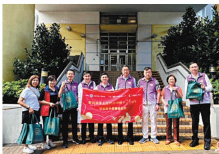
●全國政協委員到黃大仙探訪基層。

香港文匯報訊(大公文匯全媒體記者 王俊傑)中秋佳節臨近，香港友好協進會昨日組織38位港區全國政協委員，到啟德、長沙灣、黃大仙、何文田、天水圍、上水和粉嶺等社區探訪基層家庭，並獻上節日祝福。