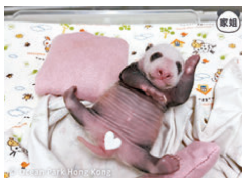
●家姐睡出一字馬。大熊貓官方Ig