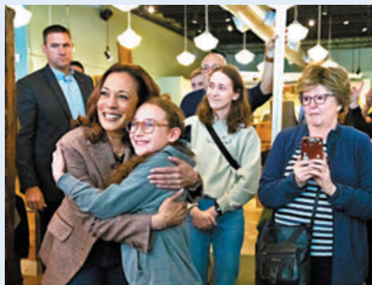
●哈里斯到賓夕法尼亞州匹茲堡拉票，其間與支持者擁抱。

特朗普和拜登在上次辯論時，雙方互相指責和人身攻擊。選民希望今次哈里斯與特朗普的辯論，能專注政策議題討論，減少政治爭吵。猶他州的共和黨人奧利弗表示，「我想看看哈里斯在與特朗普互動時，如何回答這些快速問題，也希望特朗普盡量減少攻擊，專注於政策。」獨立選民馬佐尼則稱，她沒有計劃觀看這場辯論，預計兩人不會說出任何實質性內容。