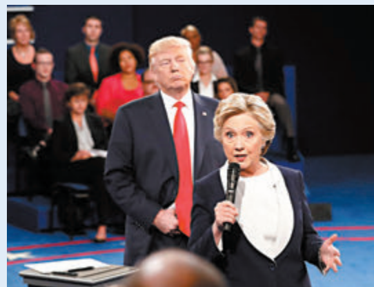
●希拉里與特朗普在2016年大選辯論交鋒。資料圖片