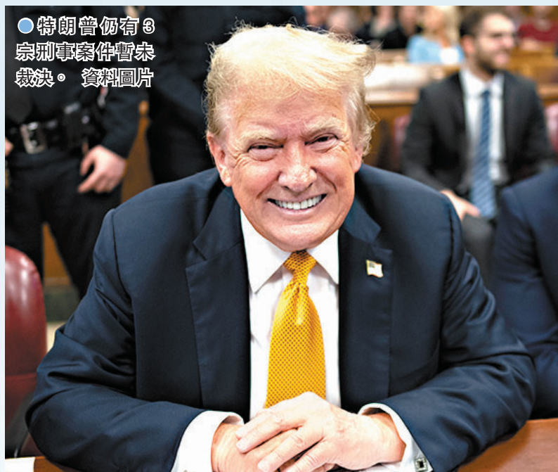
●特朗普仍有3宗刑事案件暫未裁決。