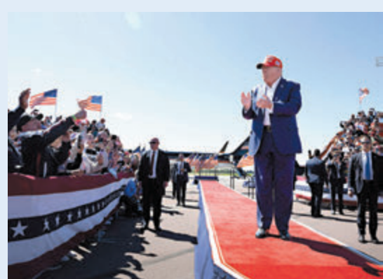
●特朗普到搖擺州威斯康星拉票。

長期以來一直奉行貿易保護主義政策的特朗普表示，美元8年來一直遭受「重重圍攻」。中國、印度、巴西、俄羅斯和南非在去年一場峰會上討論去美元化，而特朗普曾表示，他希望美元繼續保持其世界儲備貨幣的地位，他在今次造勢大會上也重申這一點。不過根據國際貨幣基金組織(IMF)的數據，儘管近數十年來美元的主導地位有所下降，但在今年第一季度，美元仍佔全球官方外匯儲備的59%，遠高於第二位的歐元(佔比20%)。但這一數字確實較2016年的65%有所下降，因此有關美元「衰敗」的傳言並非空穴來風。