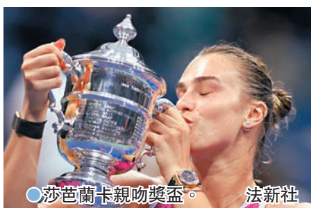
●莎芭蘭卡親吻獎盃。

香港文匯報訊 綜合新華社報道，2024年美國網球公開賽當地時間8日落幕，當日男單決賽，世界排名第一的意大利名將辛拿3：0擊敗美國選手費斯，職業生涯首次問鼎美網男單冠軍。較早時間2號種子、白俄羅斯名將莎芭蘭卡亦以2：0擊敗6號種子、美國選手佩古拉，同樣首奪美網女單冠軍。