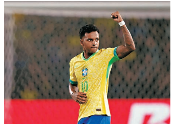
●洛迪高斯幫助巴西隊重奪勝鼓。

之前世盃外三連敗的巴西隊日前1：0小勝厄瓜多爾成功止頹，而表現受批評的前鋒雲尼奧斯奧斯祖利亞，是役作客7戰得1勝3和3負的巴拉圭，盼能重拾射門鞋。