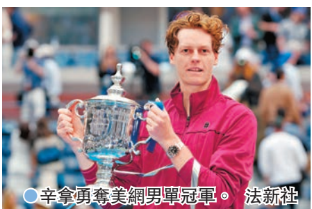
●辛拿勇奪美網男單冠軍。