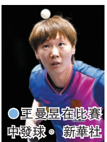
●王曼昱在比賽中發球。

香港文匯報訊 WTT 澳門冠軍賽昨天(9日)迎來首個比賽日，孫穎莎迎來了巴黎奧運會之後的首秀，她的對手是韓國選手田志希。本場比賽孫穎莎直落三局14：12、12：10、11：1戰勝對手，取得澳門冠軍賽開門紅。另一場女單32強比賽，王曼昱以3：1擊敗羅馬尼亞球手斯佐科斯，順利晉級16強。