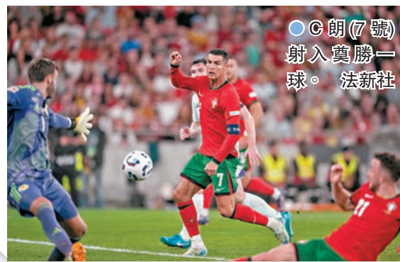
●C朗(7號)射入奠勝一球。

香港文匯報訊（記者 梁志達 綜合報導）日前斬獲職業生涯第900個入球的C朗拿度，在昨日凌晨的比賽再以入球來反擊指他應該適時而退的聲音，後備莫勝協助葡萄牙隊於主場絕殺蘇格蘭，在歐國盃A級賽第1組兩戰兩勝。