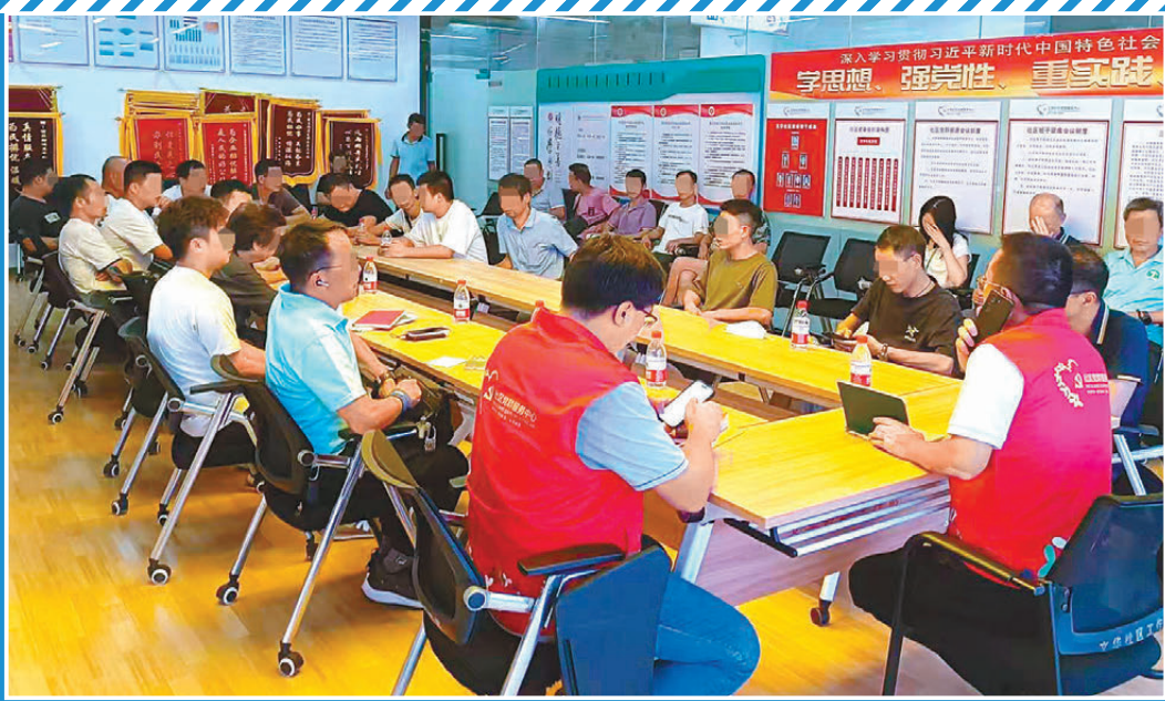
●香港建造業總工會參與協調糾紛。