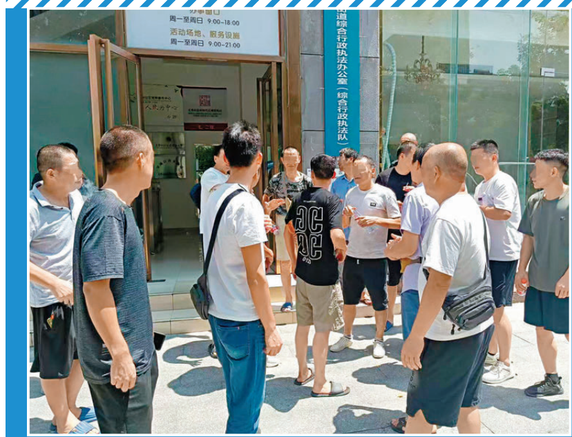
●外勞赴黃貝街道綜合行政執法辦公室求助。