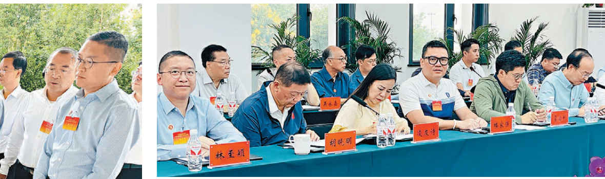
▲視察組視察開封僑務工作座談會現場。