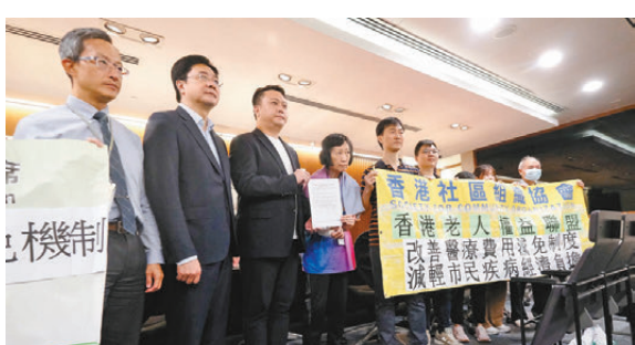
●社區組織協會等團體到立法會申訴部，反映基層病人醫療負擔沉重的問題。

社協表示，現時非綜援受助人只要通過入息及資產審查亦可申請醫療費用減免，但其每月家庭入息不可超過家庭住戶每月入息中位數的75%，建議參考申請撒瑪利亞基金的家庭定義，例如申請人屬未婚的非受供養人，只對其個人進行經濟審查而不計算其他同住家人的入息。