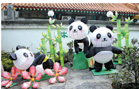
▲熊貓造型花燈將首次於黃大仙祠展示。