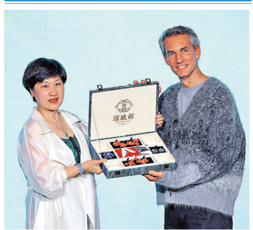
●老佛爺百貨與中國老字號品牌瑞蚨祥互送禮物。

作為較早與新中國建立外交關係的西方大國，法國與中國之間的交流頻繁且密切。此次時尚秀的主題「法韻華章」，既結合法式浪漫風情又蘊含中式傳統底蘊，再現法式浪漫和中華文化互相吸引的磁力。作為高奢和浪漫法式文化的代表，老佛爺百貨自巴黎首店誕生以來一直是潮流的代名詞與時尚藝術的朝聖地。在進入中國市場後，老佛爺百貨跳出百貨的界限，更多地承擔了中法兩國之間文化交流、商業橋樑的角色。