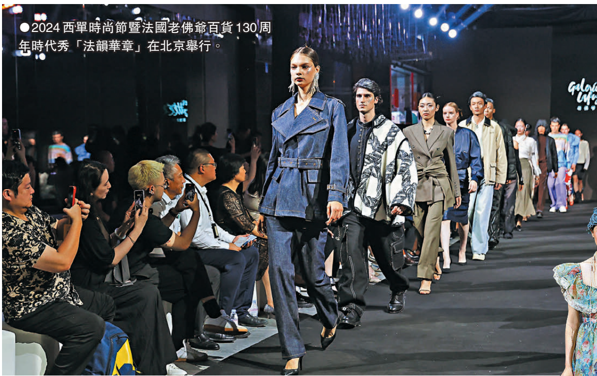
●2024 西單時尚節暨法國老佛爺百貨 130 周年時代秀「法韻華章」在北京舉行。