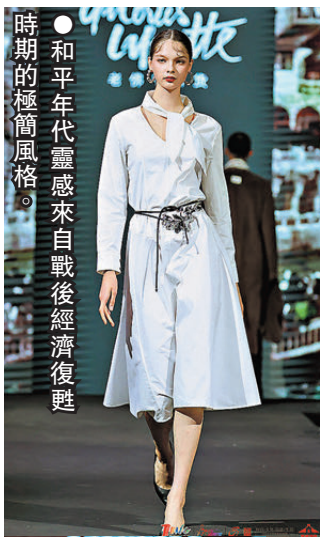
●和平年代靈感來自戰後經濟復甦時期的極簡風格。服裝設計以簡潔的線條和樸素的色彩為主，體現出戰後人們對實用與舒適的追求。模特兒展示了裁剪精良的經典大衣、簡潔的連衣裙和高腰褲，搭配低調的配飾。天然纖維和環保面料的使用，不僅體現了對簡約美學的追求，也傳遞出可持續發展的理念。