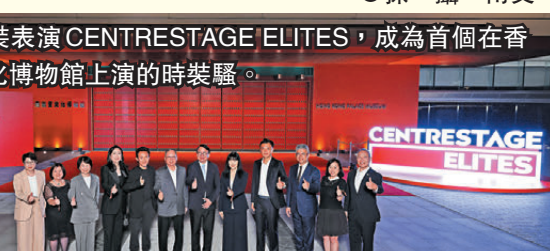
●開幕時裝表演 CENTRESTAGE ELITES，成為首個在香港故宮文化博物館上演的時裝騷。

科技年代系列探索了現代性、科技和可持續性的交匯點，展示了對未來的時尚的願景。模特兒穿着融合高科技面料、智能穿戴和可持續材料的服裝，突出環保意識與科技創新的結合。設計風格多樣，從簡約的未來主義到充滿活力的現代藝術影響，體現出多樣性和包容性的融合。該系列不僅展示了未來時尚的無限可能，還強調了環保和技術進步的重要性，旨在激發一個充滿思考和前瞻性的設計新時代。