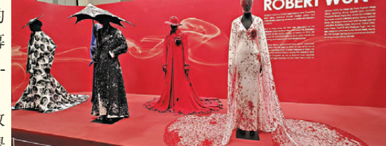
●科技年代系列展示了對未來時尚的願景。模特兒穿着融合高科技面料、智能穿戴和可持續材料的服裝，突出環保意識與科技創新的結合。設計風格多樣，從簡約的未來主義到充滿活力的現代藝術影響，體現出多樣性和包容性的融合。該系列不僅展示了未來時尚的無限可能，還強調了環保和技術進步的重要性，旨在激發一個充滿思考和前瞻性的設計新時代。

八零年代系列以「摩登魅力」為主題，展示了 1980 年代的時尚風潮。模特兒身著具有代表性的誇張墊肩、緊身牛仔褲和霓虹色彩的服飾，生動展現那個時代的大膽與張揚。辦公室女郎風格的職場裝扮，如鋒利裁剪的西裝和高腰鉛筆裙，將都市女性的自信與力量呈現。該系列通過金屬質感的面料、耀眼的配飾和大膽的圖案，重現了八零年代的活力與時尚前沿。