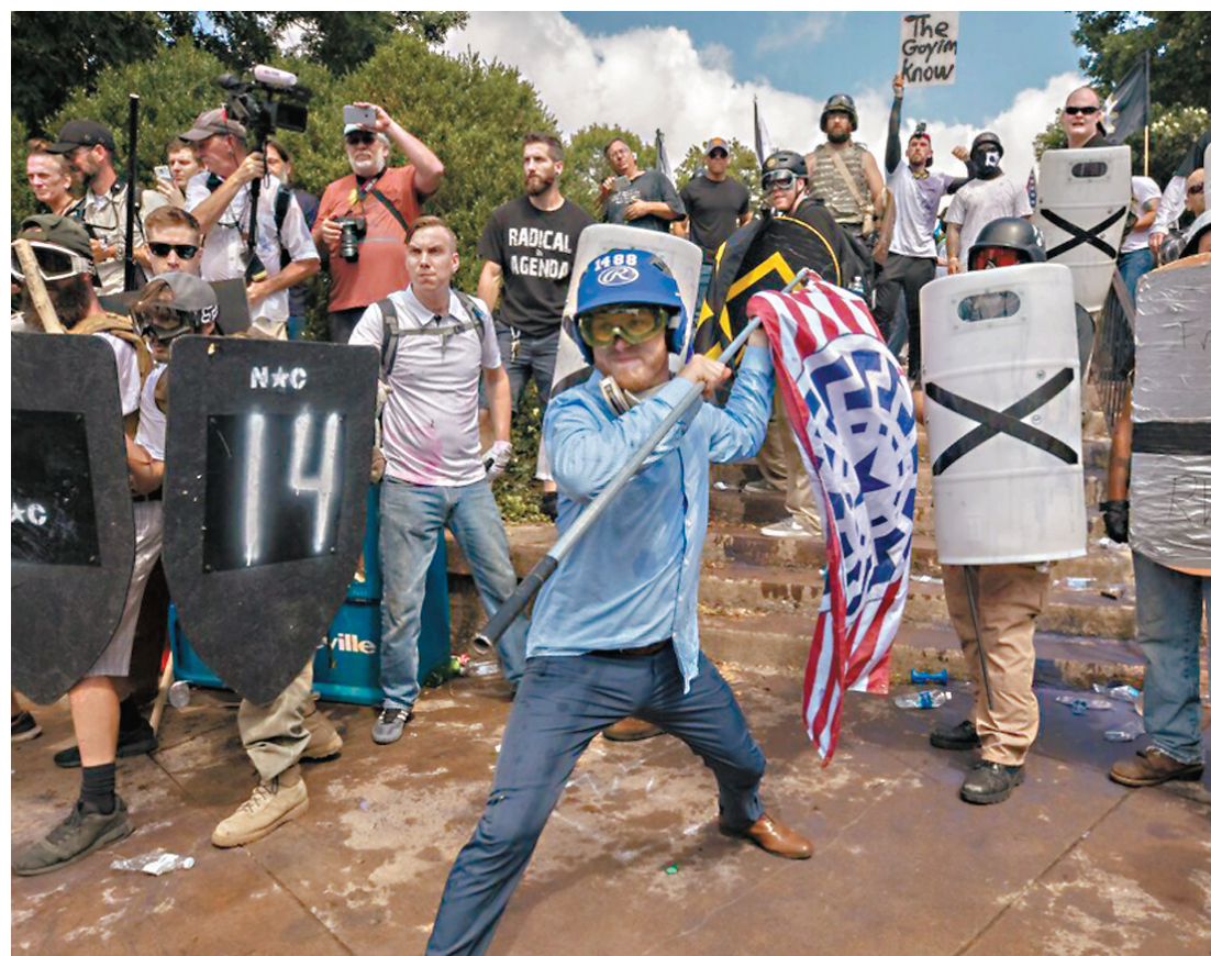
●白人種族主義者在弗吉尼亞州一場集會上引發衝突。