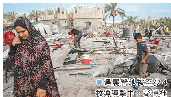
●遇襲營地被至少4枚導彈擊中。

香港文匯報訊 巴勒斯坦加沙民防部門周二（9月10日）說，以色列軍隊當天凌晨襲擊加沙南部汗尤尼斯馬瓦西人道區，造成至少40人死亡及60人受傷。