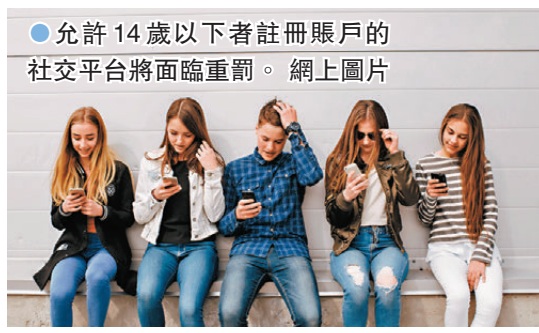
●允許14歲以下者註冊賬戶的社交平台將面臨重罰。

此前，南澳州已率先草擬禁止14歲以下兒童使用社交平台的立法，相關法案將為Facebook、Instagram和TikTok等平台建立系統性社會責任，確保它們採取一切合理措施，禁止兒童使用其平台。