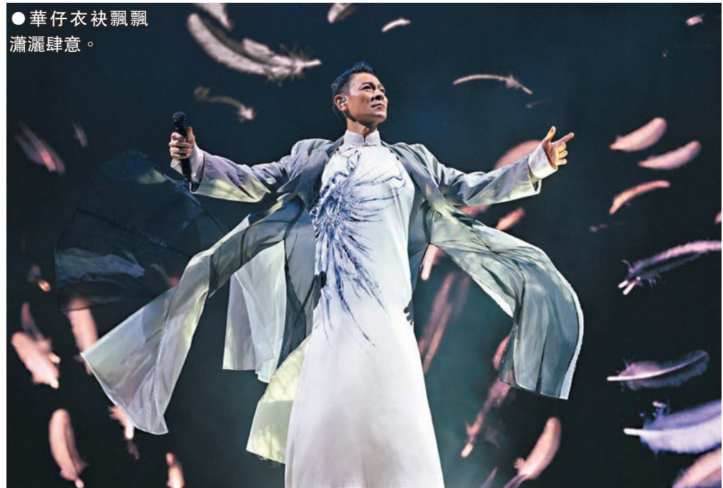
華仔衣袂飄飄瀟灑肆意。