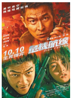
華仔新作《危機航線》將於10月在香港上映。

在《危機航線》的最新預告及海報中,首度披露片中劫機事件牽涉五億美金之多的巨額贖金,預告中展現了機艙內劉德華以及屈楚蕭鬥智鬥勇,持槍對峙、近身搏鬥、以致引擎爆炸等震撼眼球的畫面。而劉德華飾演的國際保安專家大展身手,在三層機艙的狹窄空間內單挑劫匪團,竭力瓦解對方並營救家人和機上乘客;而首演盲女角色的張子楓臨危不亂,展現了強大的心理素質。屈楚蕭飾演的劫匪狠毒囂張,跟華仔上演一場如貓捉老鼠的遊戲。