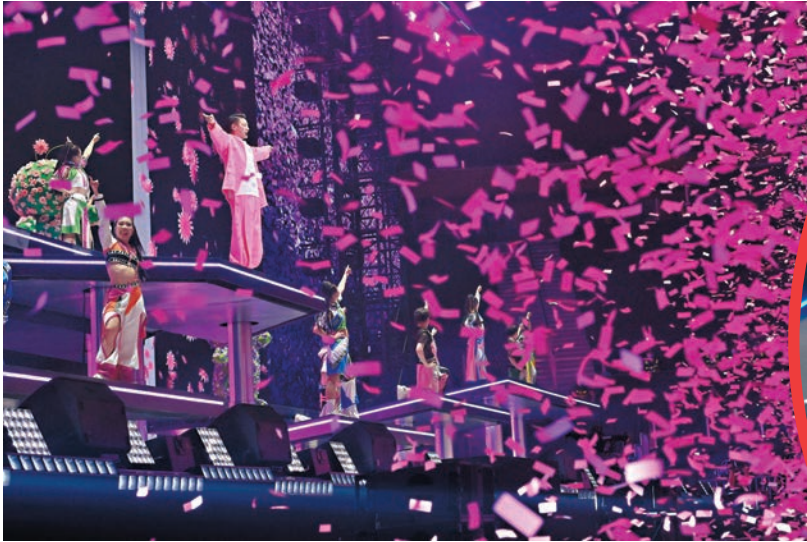
華仔前晚完成36場內地演唱會。