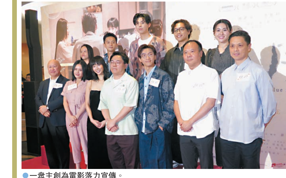
一眾主創為電影落力宣傳。

另談及導演王晶於網上節目重提舊事,指2000年拍電視劇有兩位女演員為了他爭風吃醋發生掌摑事件,網民即猜測當年在拍《美麗傳說》,兩位女演員分別是李麗珍和陳法蓉。珍妹被問及掌摑事件,她直言:「經歷那麼多年風風雨雨,我都不知道是什麼事,如果你們知道是什麼事可以講給我知。」有否經歷過王晶所說的場面?珍妹說:「應