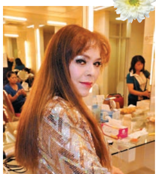
黎愛蓮於9月1日安詳辭世。

黎愛蓮是香港上世紀六十年代至七十年代的著名歐西流行曲女歌手,曾與李小龍的胞弟李振輝發行細碟《Baby Baby》,並於1972年接拍了吳思遠執導的動作片《餓虎狂龍》踏足影壇。1975年,她與梁小龍奉女成婚,婚事低調處理,二人秘密簽紙,未在港設婚宴,而同年女兒梁子文出世。及至1979年,她遭兇徒淋潑滾水襲擊毀容,令當紅的她身心重創,在一年間接受近20次植皮及磨皮手術重整面