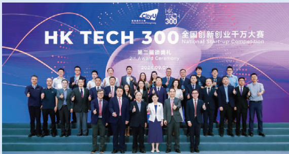
▲東莞市副市長黎軍（前排右三）、城大校董會成員梁少康（前排左三）、城大高級副校長（創新及企業）楊夢甦（前排右二）、城大副校長（內地策略）魯春（前排左二）、9個賽區城市代表、一眾評審與12間勝出初創企業代表在頒獎典禮上合影。