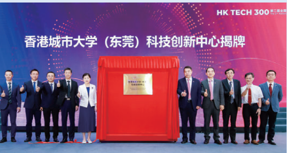
▲東莞市副市長黎軍（左五）與城大副校長（內地策略）魯春（右五）一同主持「香港城市大學（東莞）科技創新中心」的揭牌儀式。