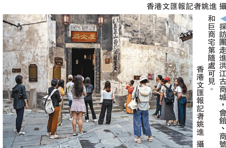
▲採訪團走進洪江古商城，會館、商號和巨商宅第隨處可見。