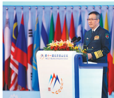
▲國防部長董軍作主旨發言。新華社 ▲9月13日，第十一屆北京香山論壇在北京國際會議中心開幕。新華社