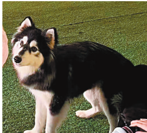
▲遭虐打致死的阿拉斯加雪橇犬「胖虎」。