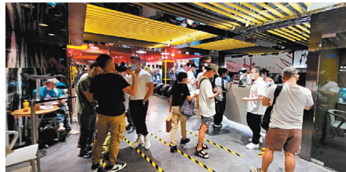
●昨日續有市民前往灣仔京城大廈HEALTHY查詢了解。