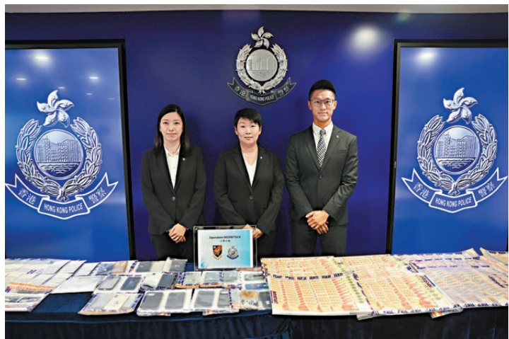
●警方講述代號「沉擊」行動搗破一個跨境洗黑錢集團案件詳情及展示證物。

香港文匯報訊（記者 蕭景源）警方商業罪案調查科與銀行業界合作，於前日展開代號「沉擊」行動，搗破一個活躍香港及內地的跨境洗黑錢集團。該犯罪集團招攬內地居民在虛擬銀行開立傀儡戶口接收騙案得益，再由傀儡戶口持有人將錢轉去自己名下的傳統銀行戶口，以現金形式提取，最後到虛擬資產找換店購買加密貨幣。警方鎖定及拘捕14名犯罪集團成員，涉利用43個香港的銀行戶口，清洗超過2.3億元各類騙案的騙款，稍後以洗黑錢罪名落案起訴14人。