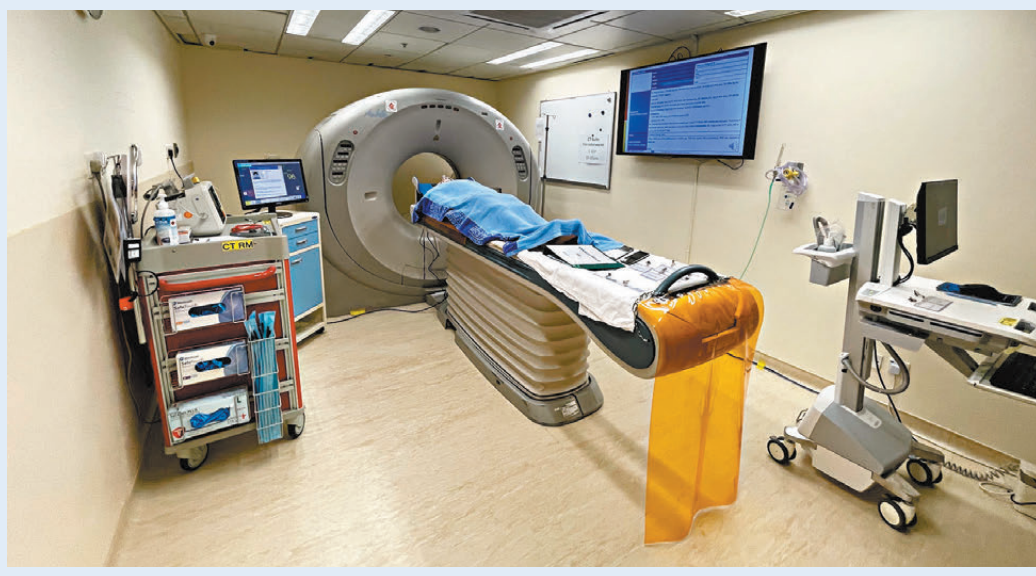
● 急症科訓練中心把地庫改裝為面積達5,000呎的模擬訓練室，包括添置模擬電腦掃描室。

在前線進行急救的醫護人員，都會遇到不同程度的創傷個案。劉曉昕分享令其中印象最深刻的經歷時表示，當時一名男士因為突發性心肌梗塞而在路邊暈倒，被送往醫院急症室時情況已十分危急，她立即以自動體外心臟去顫器為病人施以電擊，以及為他注射強心針，終在分秒必爭的搶救情況下將病人從「鬼門關」前救回一命，「見到患者恢復心跳那一刻，我才稍稍放下緊張的心情。」