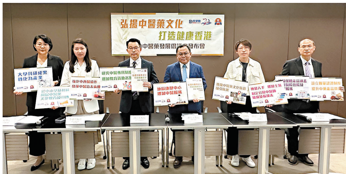
● 民建聯昨日公布《推動中醫藥發展倡議書》，建議特區政府多管齊下優化中醫藥服務，包括提供更多政府資助中醫服務等。