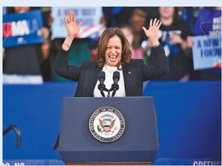
●哈里斯到北卡羅萊納州拉票。

哈里斯與特朗普均轉赴搖擺州舉行造勢活動。哈里斯前往北卡羅萊納州，競選團隊表示她進入「更積極強勢」的階段，會在辯論後乘勝追擊，更頻繁接觸傳媒，特朗普則前往亞利桑那州。