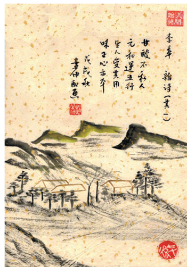
李華 雜詩(其一) 甘酸不私人，元和運五行。生人受其用，味正心亦平。……

「甘酸不私人，元和運五行。生人受其用，味正心亦平。……聖人不能絕，鑽燧與炮烹。……顏子有餘樂，瓢中寒水清。」李華是唐代著名散文家，《雜詩六首》是他著名的作品。此次選取的這幾句較淺白，其餘的頗為深奧，如道家學問一樣。