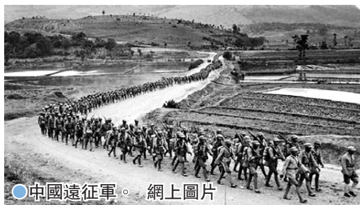
●中國遠征軍。

1944年4月，為實施滇西大反攻的中國遠征軍滇西部隊組建完成。為了打好這場仗，向同盟國表明中國人民抗戰決心意志，蔣介石命令，除了原有的第6軍、第8軍、第53軍和第54軍等國民黨中央軍精銳部隊外，將國民黨中軍精銳第2軍、第5軍和第71軍也全部編入滇西中國遠征軍。滇西大反攻由中國遠征軍代總司令衛立煌指揮，參戰部隊有宋希濂為總司令的第11集團軍和霍揆彰為總司令的第20集團軍兩個集團軍及直屬特種兵部隊，共16個師16萬多人，先期在怒江邊集結的兵力約10萬人。但據有關資料，遠征軍師的編制應為1.3萬人，由於長期嚴重缺編，兩集團軍16個師僅實達12萬餘人，反攻開始時僅實有7.2萬人。遠征軍長官司令部駐怒江東岸保山板橋附近的