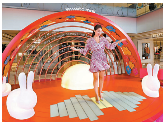
●大家可在黑膠唱盤造型舞台上，以腳踏形式體驗唱片上的互動發光效果。

由即日起，wwwtc mall將商場中庭打造成一個多重感官體驗的「月滿幸福之旅」中秋藝術裝置，以代表着人月兩團圓、標誌性發光的月亮作為主景，搭配糅合傳統藝術及時尚感、色彩奪目的黑膠唱盤為主題的舞台。走進裝置中，大家除了可以腳踏的方式啟動唱片上的燈效，體驗黑膠唱盤上的發光互動效果外，更可坐上模擬唱針的打卡座，細味着動人的樂曲，踏上月滿幸福之旅，感受多重感官體驗，兼且打卡留念；而裝置上綴以不同中秋賀詞，祝福中秋佳節人團圓。