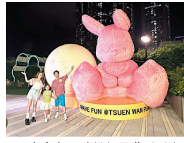
●5米高多巴胺粉紅巨型兔兔及3米高巨型滿月

由即日起至10月31日，荃灣廣場將為大家帶來「Blooms of Happiness快樂綻放」，以Y2K多巴胺風格與大家一起迎接秋月！打頭陣為大家帶來5米高多巴胺粉紅巨型兔兔及3米高巨型滿月，是次為大家打造了22米長快樂因子打卡牆，當中加入了聯乘Rainbow Creative Arts號召超過50位小朋友們親手繪出「童趣壁畫」，同場更設逾200個小燈籠製成的糖果色幸福燈籠陣，另外更為大家準備了不少中秋特備節目，盡情綻放多巴胺！