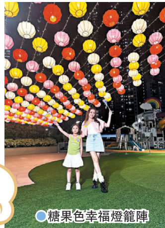
●糖果色幸福燈籠陣