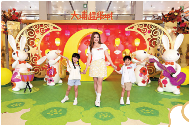
●「中秋樂悠揚」主題布置

今個中秋，大埔超級城C區舞台上空懸掛着閃亮奪目發光的月亮，而在舞台上，一隻戴着指揮家帽的巨型萌兔手持指揮棒，在月球舞台神氣指揮，演奏動人樂章。舞台上還有萌兔音樂家陶醉地彈奏着月琴，吹奏着長笛，敲打着小鼓，奏響熱鬧樂章，大家可在不同角度近距離與音樂家兔兔們自拍，在社交平台上與人分享音樂的喜悅。