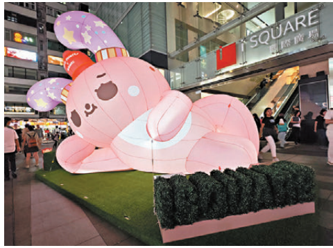
●6米高巨型「小襪兔」吹氣公仔化身可愛玉兔，躺臥商場地下iPIAZZA草地。

中秋不一定只有天上的玉兔，地上的玉兔也可以應節感十足，幸福驚喜滿滿！由即日起至10月6日，iSQUARE國際廣場聯同Sockie Rabbit「小襪兔」首度呈獻「甜『襪』花園」，6米高巨型「小襪兔」吹氣公仔化身可愛玉兔，萌爆躺臥商場地下iPIAZZA草地，與一眾好友幸福賞月。這隻巨型「小襪兔」更約了一班好友包括招財豬、忙忙貓及汪汪齊齊閃閃發亮，為花園譜奏浪漫氣氛，大家可以Chill住賞兔又賞月，沉浸在滿滿的浪漫秋色之中。同時，在大堂樓層iEXHIBITION「花園」創意打造「小襪兔」精緻夾公仔機，2米高的「小襪兔」拿着最愛的楊桃燈籠，全程伴你打打氣夾公仔。