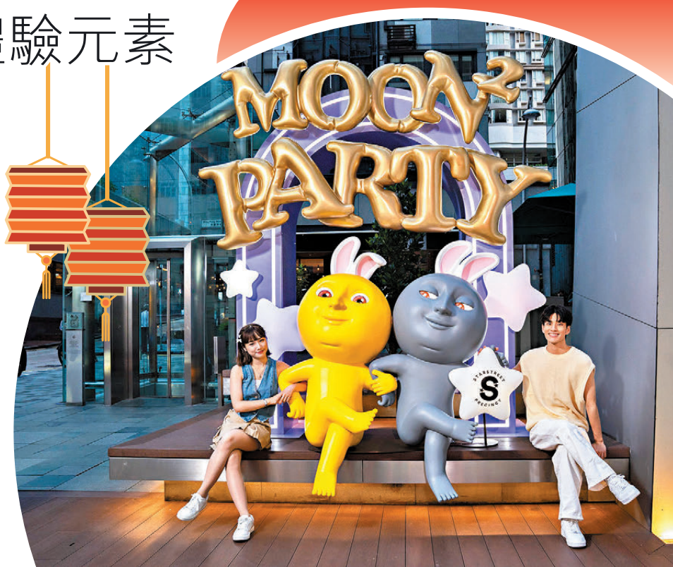
▲人氣動畫角色 Mr n Mrs Moon空降星街小區