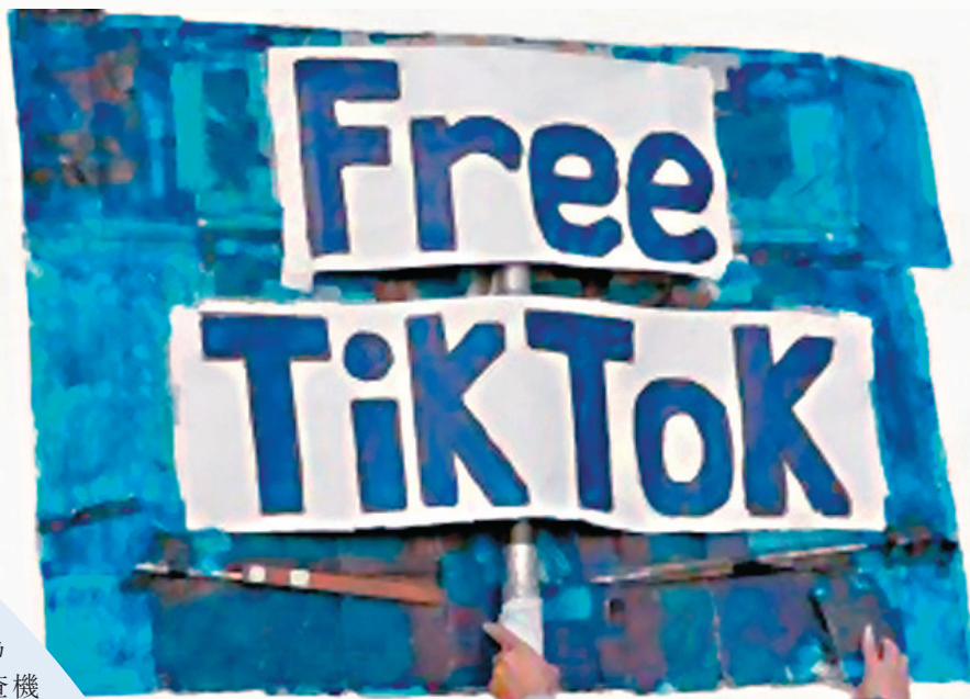
●早前有大批網民在紐約舉行撐TikTok集會。

NYSBA指出，TikTok上的帖文是由美國用戶自願和有意地在其選擇的平台上發布，並清楚地知曉在發布後就會公開。NYSBA強調封殺TikTok法案對言論的限制遠遠超出必要範圍，違反了憲法第一修正案，並一針見血地指出所謂「國家安全」僅是藉口。