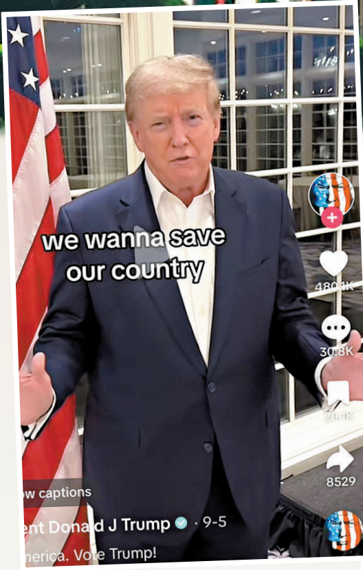
●美政府推動TikTok禁令，但兩名總統候選人又用TikTok宣傳。網上圖片